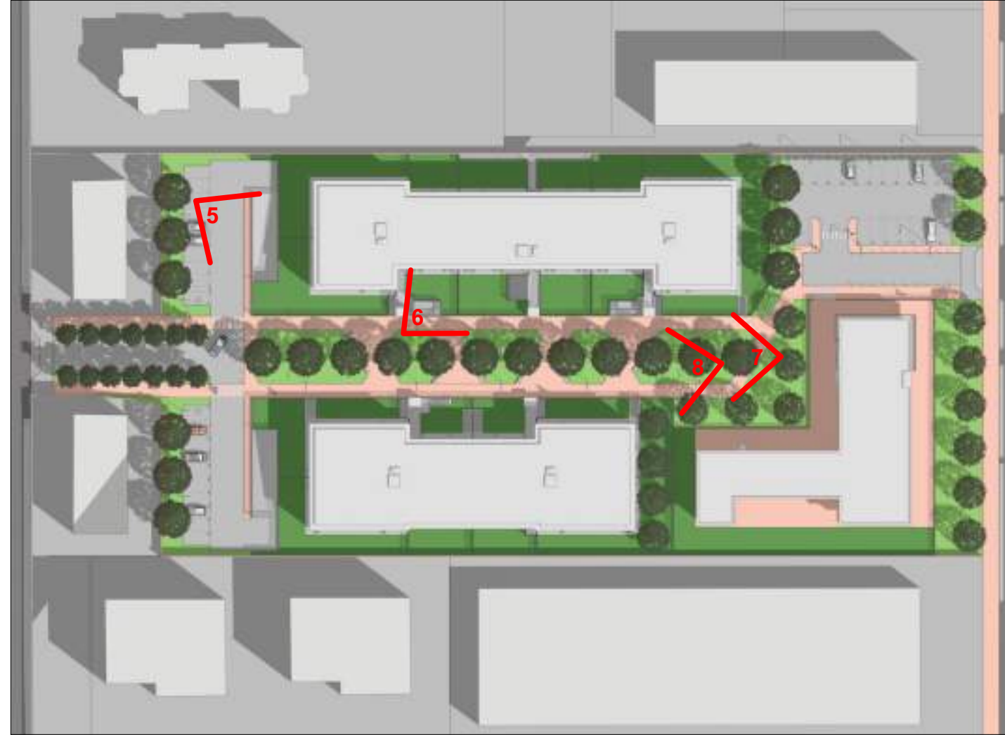
PLANIVOLUMETRICO DI PROGETTO CON PUNTI DI PRESA