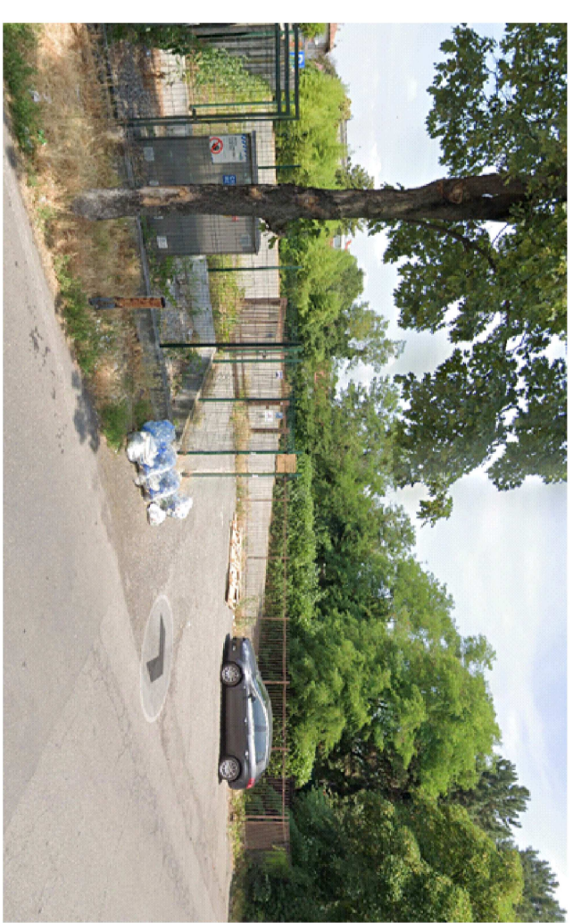
Ingresso 2 via Brescia