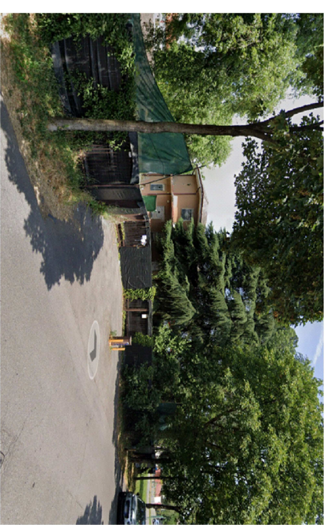
Ingresso 1 via Brescia