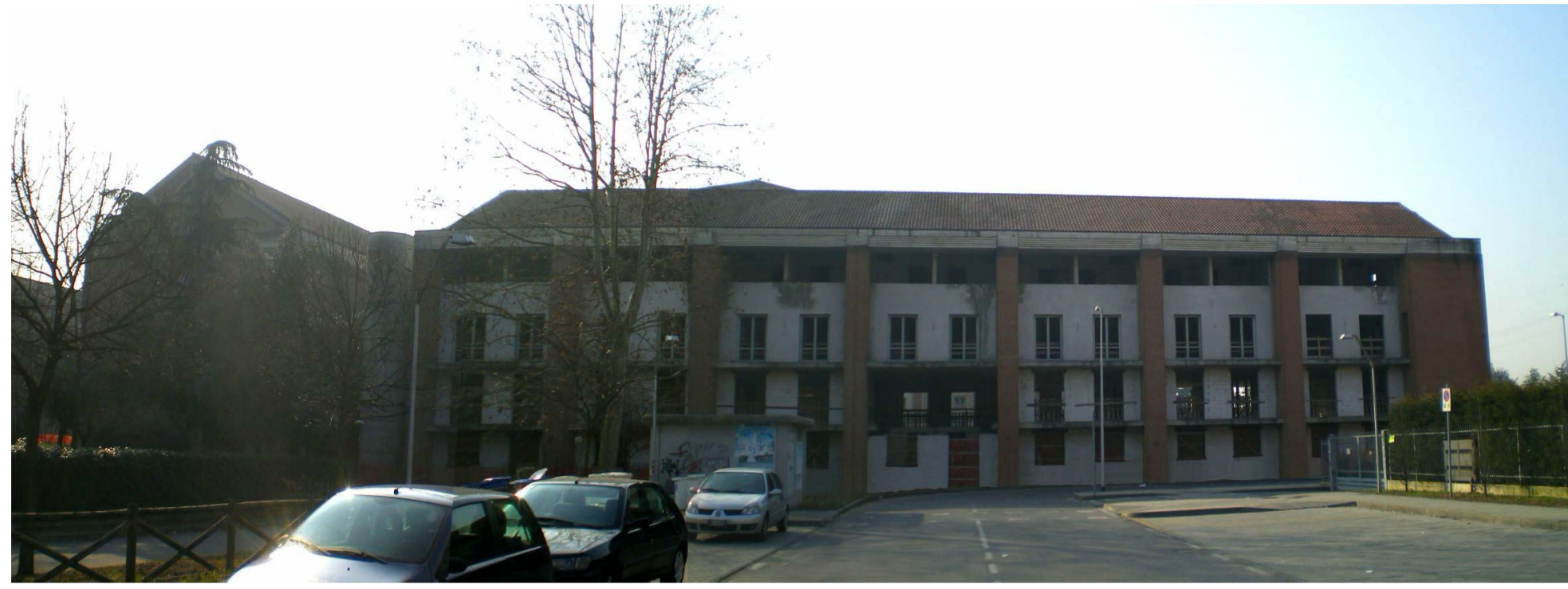
VISTA LATO NORD