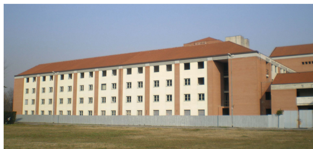
VISTE LATO SUD