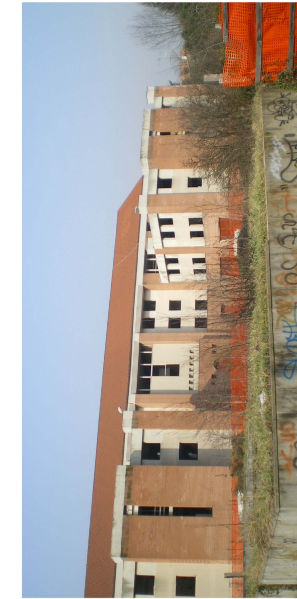
VISTA LATO EST