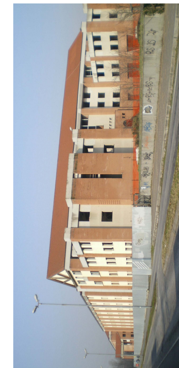
VISTA LATO EST