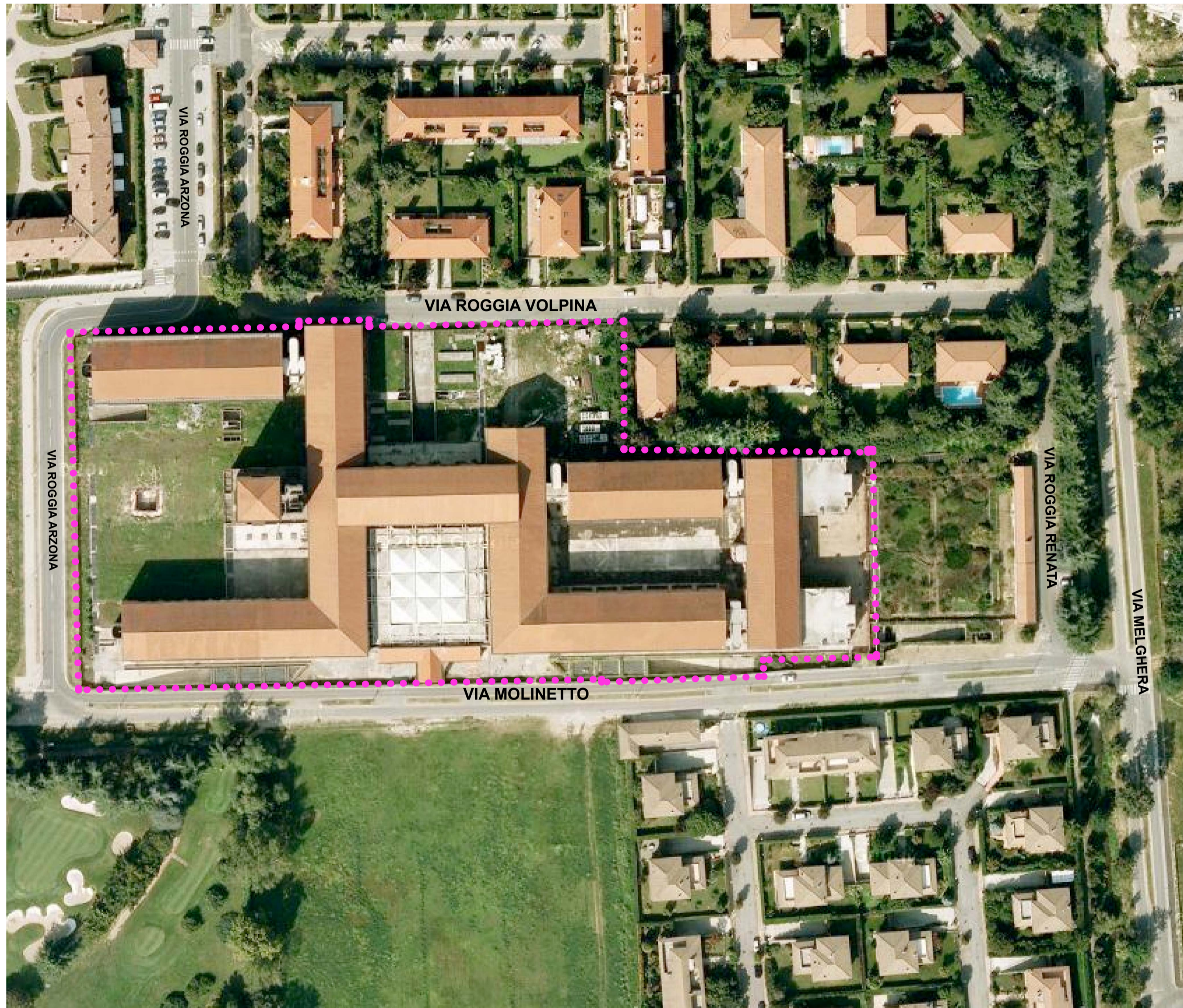
AEROFOTO SCALA 1:1000