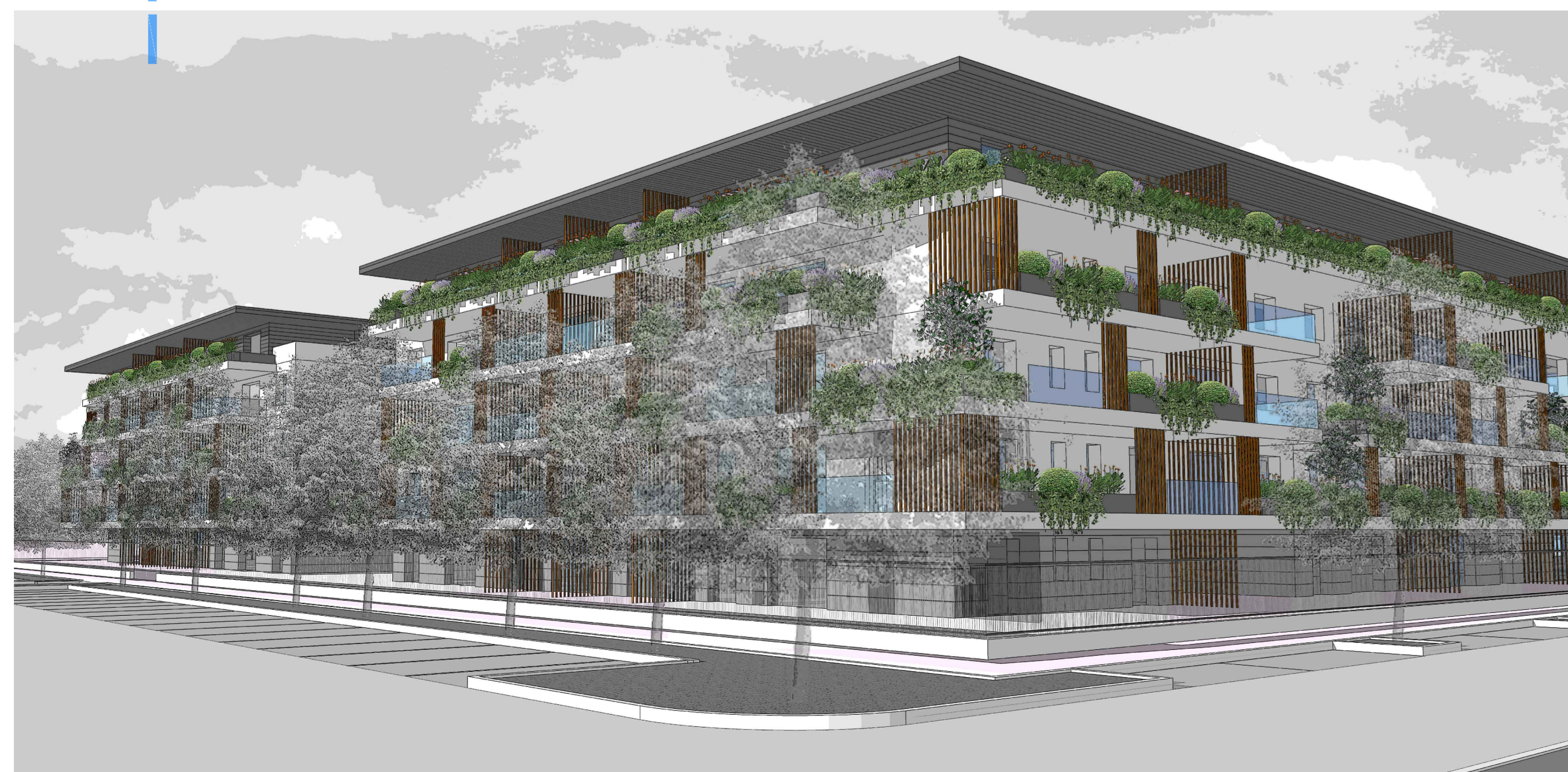
VISTA 3 - FRONTE SUD-OVEST (COMPARTO A - EDIFICIO A+B)