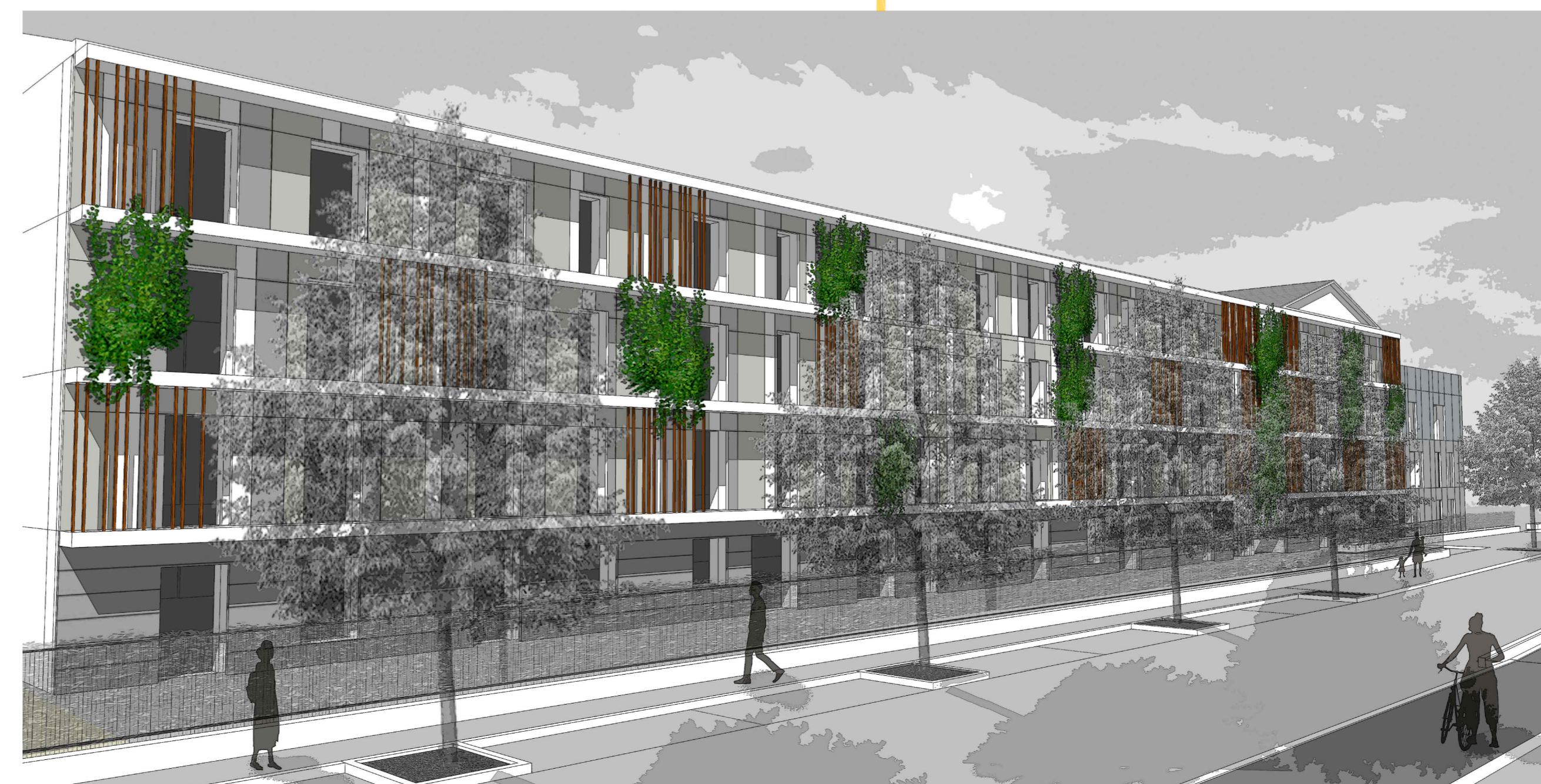
VISTA 4 - FRONTE SUD- EX ALBERGO DA RIQUALIFICARE