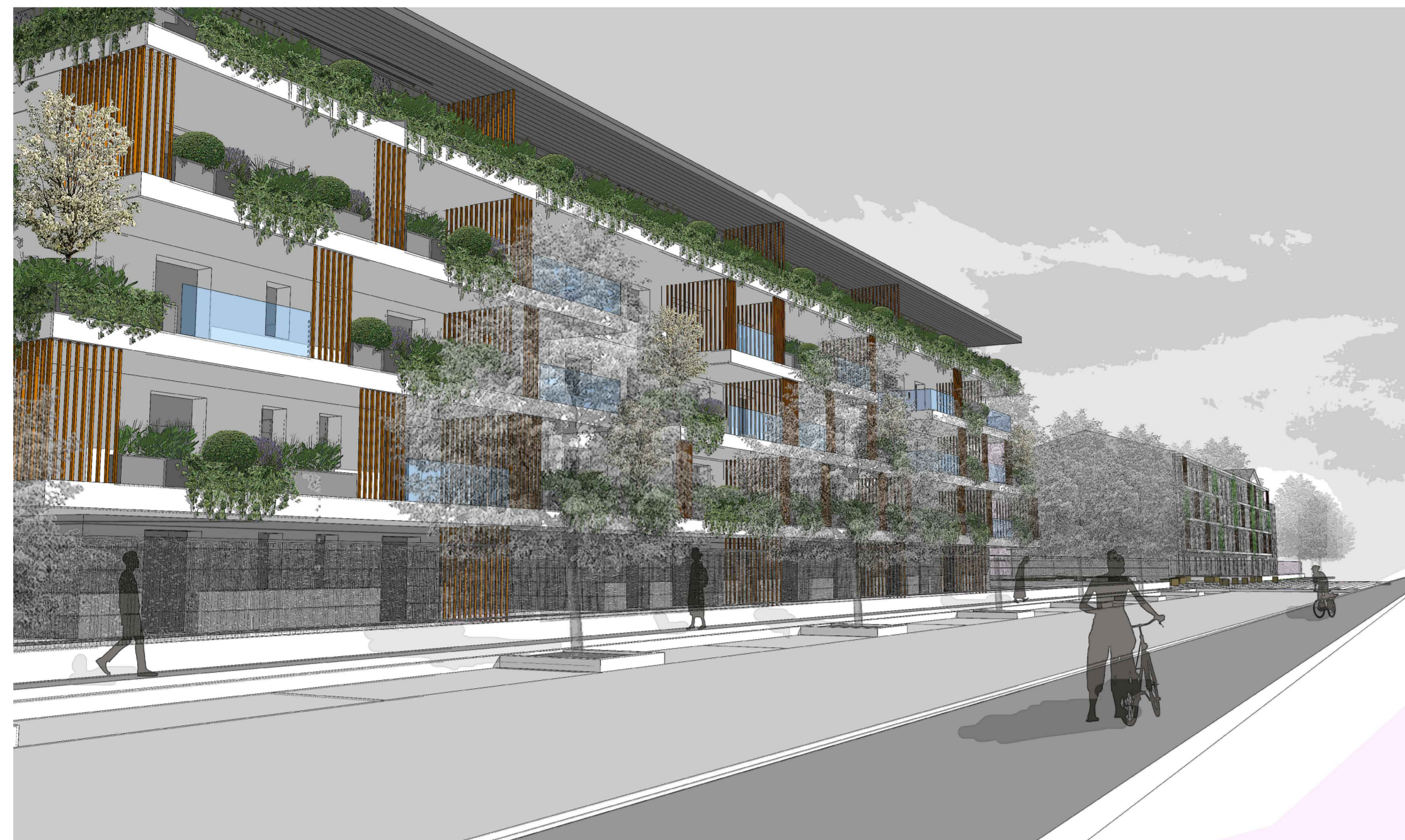
VISTA 1 - FRONTE SUD