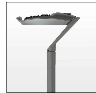
ITALO 2 URBAN TP , AEC - H 5 m PALO DELLA LUCE - ILLUMINAZIONE PIAZZA/PERCORSO PEDONALE