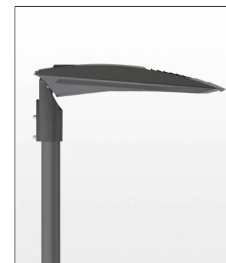
ITALO 1 , AEC - H 8 m PALO DELLA LUCE - ILLUMINAZIONE STRADE