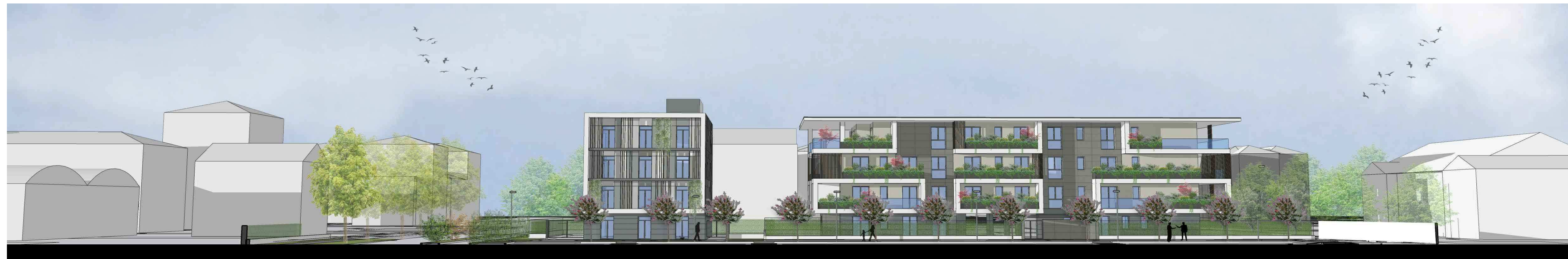
Vista 1 -FRONTE URBANO SU VIA FIUME