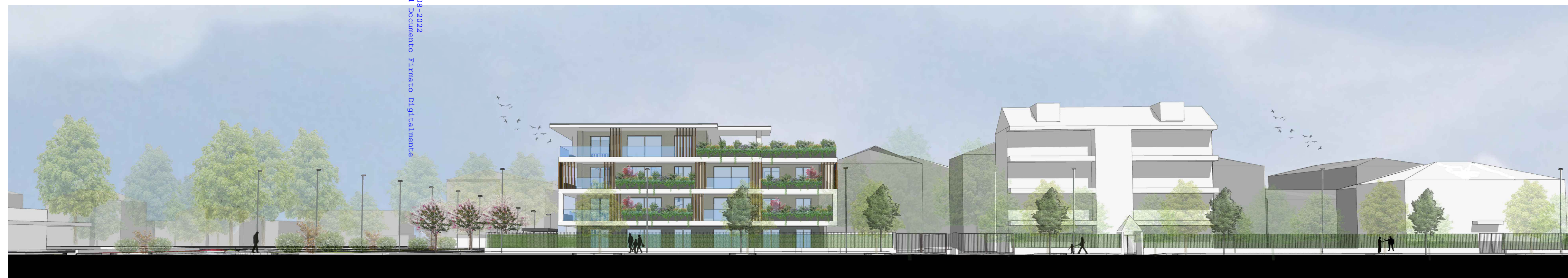
Vista 3 -FRONTE URBANO SU VIA POLA