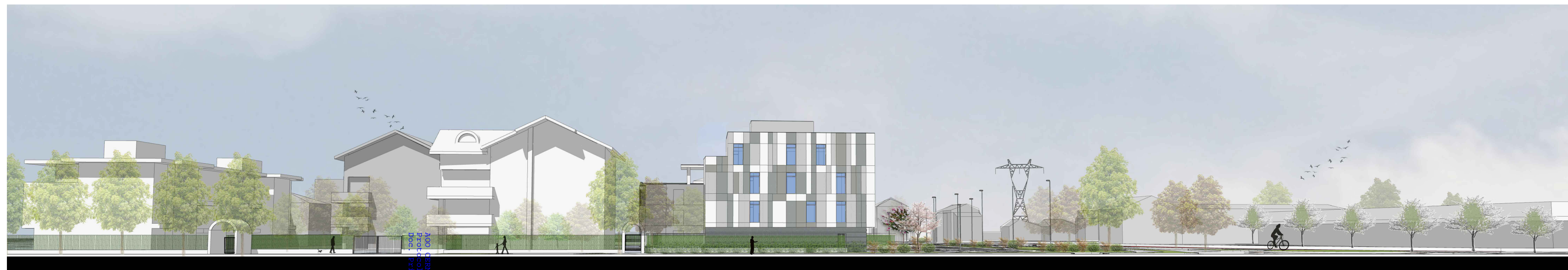
Vista 2 -FRONTE URBANO SU VIA VERDI