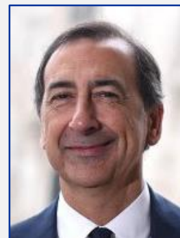
Giuseppe Sala Sindaco di Città Metropolitana Milano

Con la candidatura di Cernusco sul Naviglio a Città Europea dello Sport per l'anno 2020 non si presenta una sola città, ma un intero territorio.