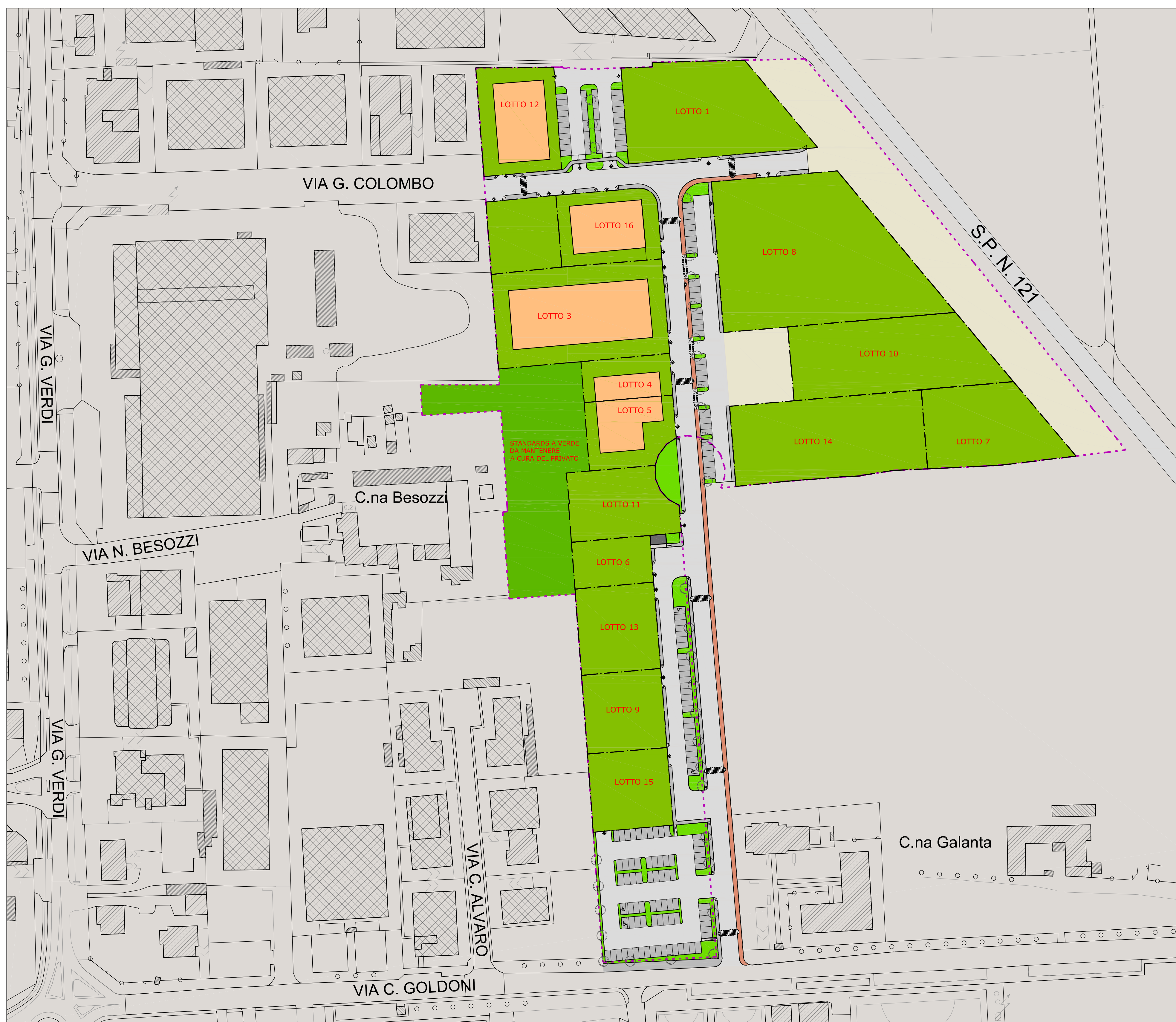
STATO DI FATTO ATTUAZIONE COMPARTO PL8