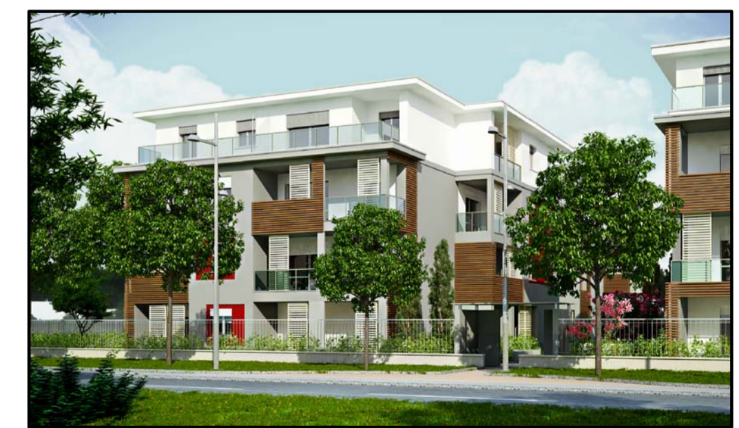
Fotoinserimento vista da Ovest