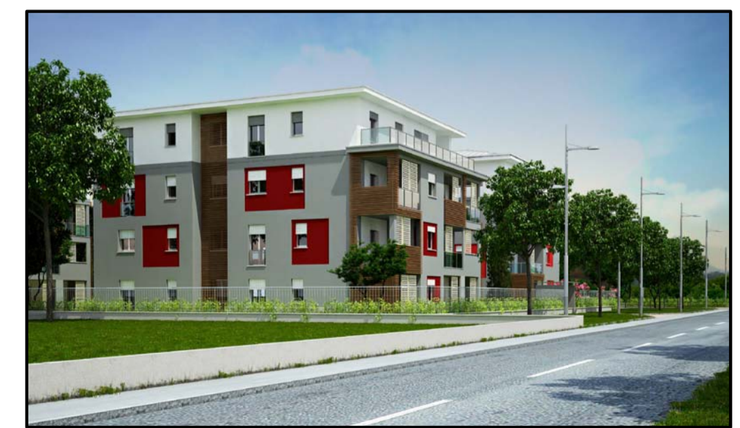
Fotoinserimento vista da Nord

N.B. I materiali e le indicazioni cromatiche sono da definirsi in fase di progettazione esecutiva