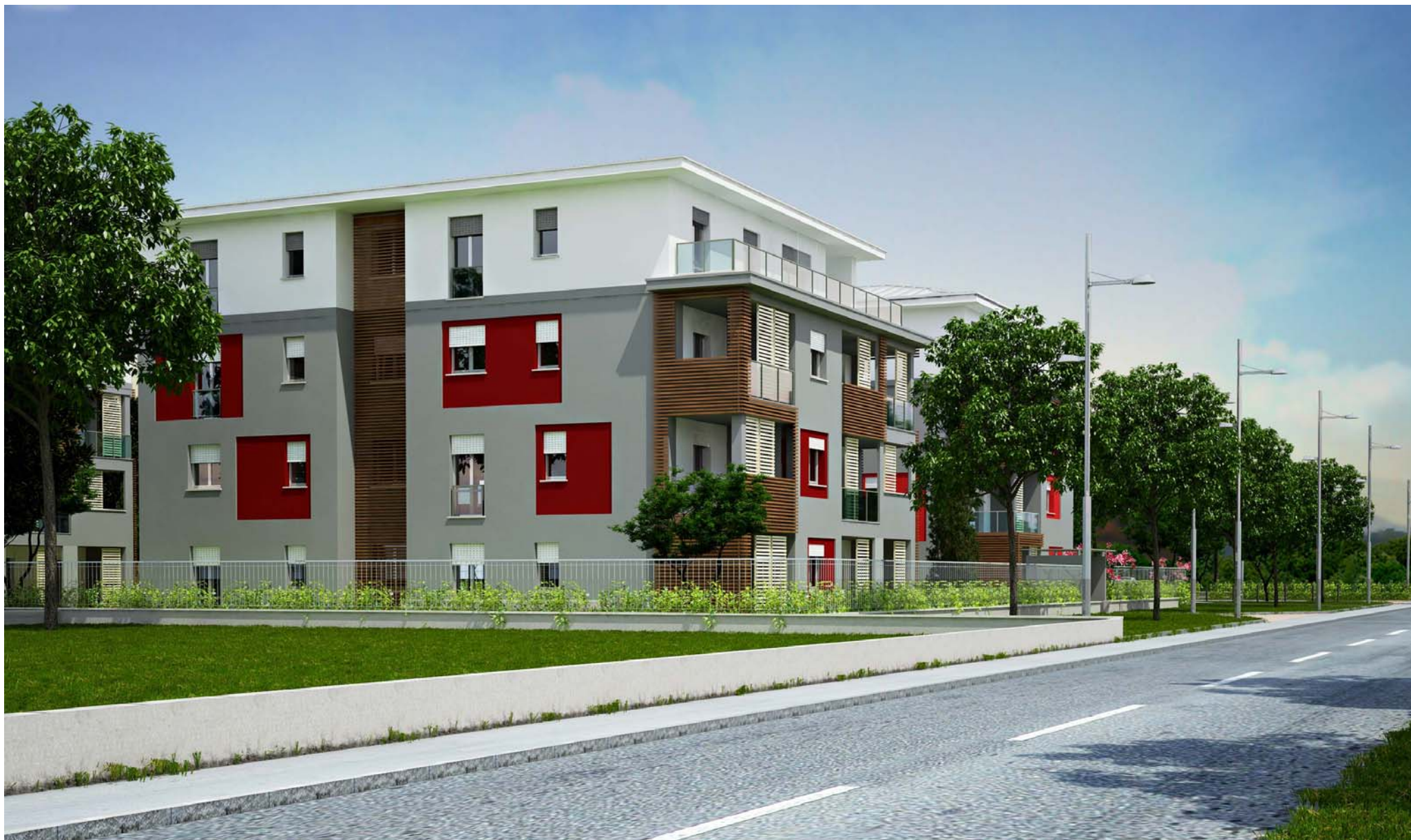
VISTA NORD-OVEST VIA PASUBIO