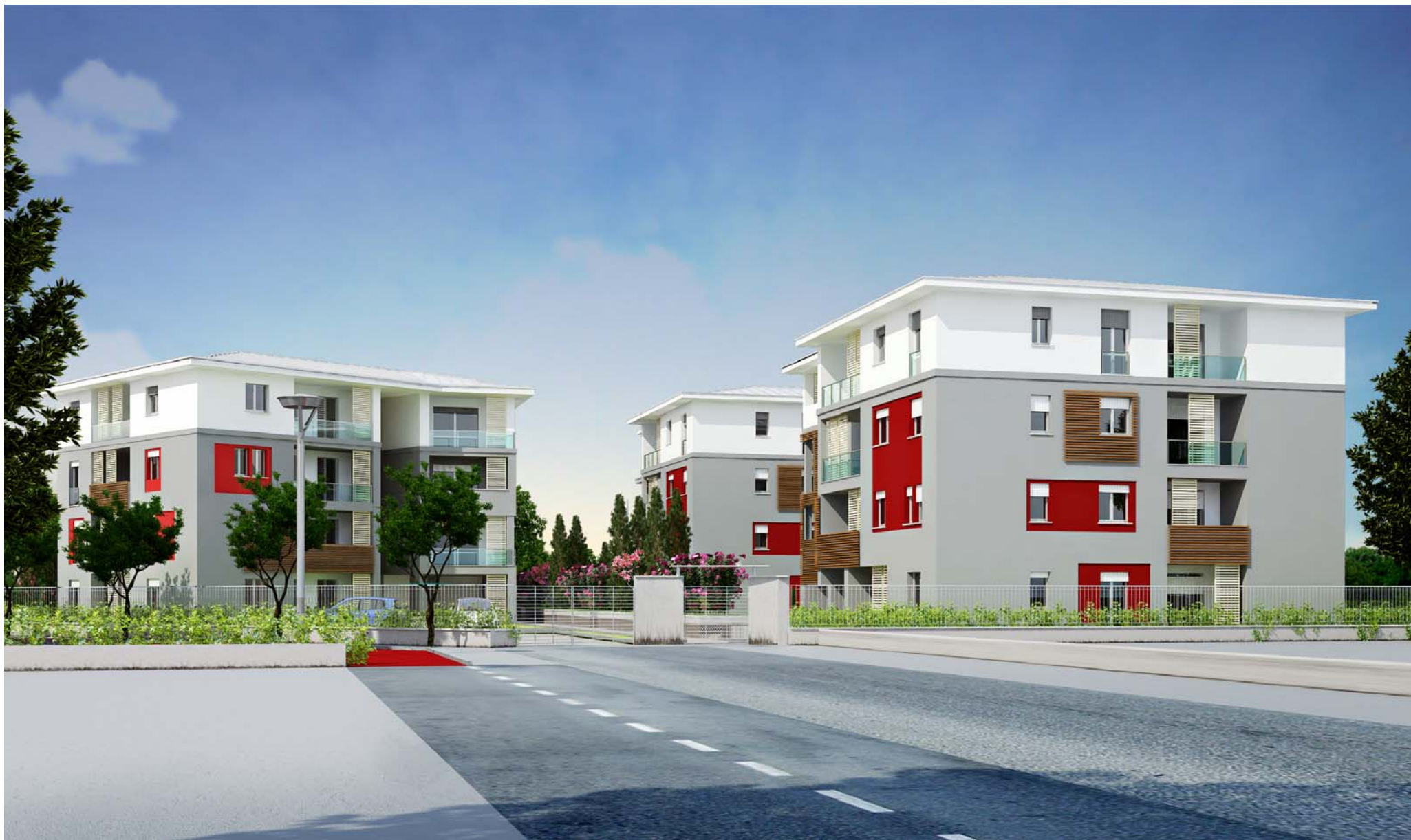
VISTA EST VIA ROSSINI