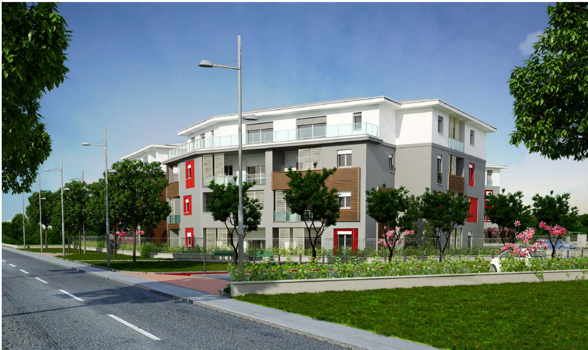
VISTA SUD-OVEST VIA PASUBIO