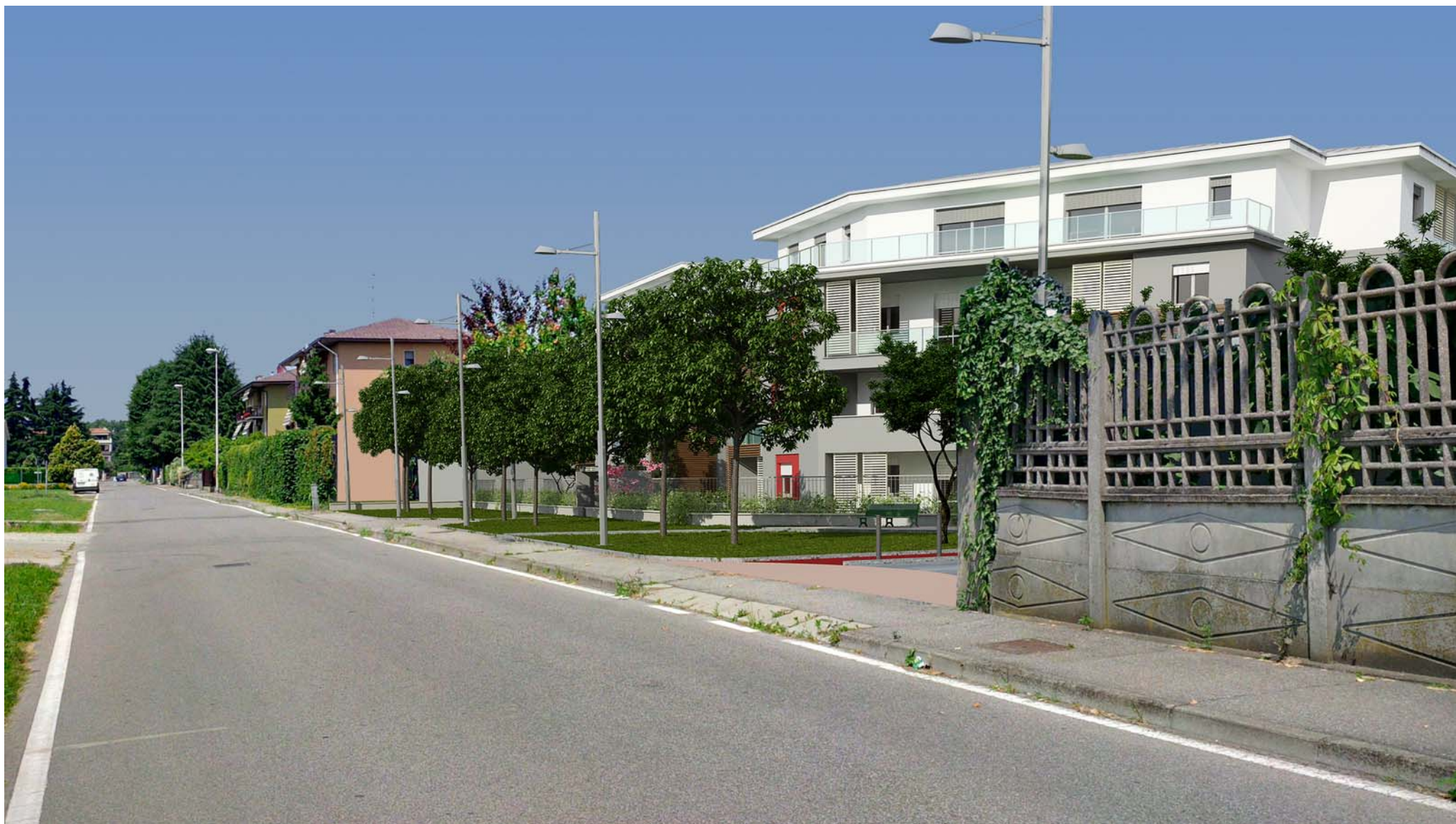
FOTOINSERIMENTO VISTA SUD-OVEST VIA PASUBIO