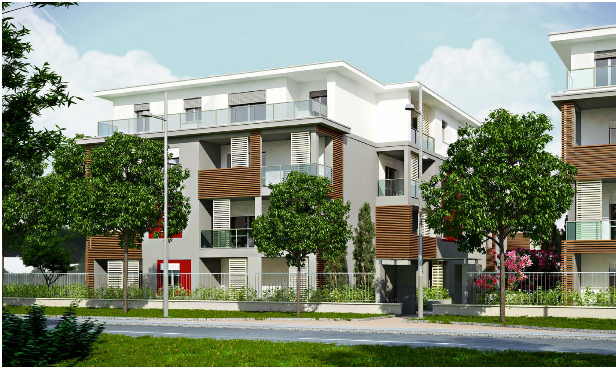
VISTA OVEST VIA PASUBIO