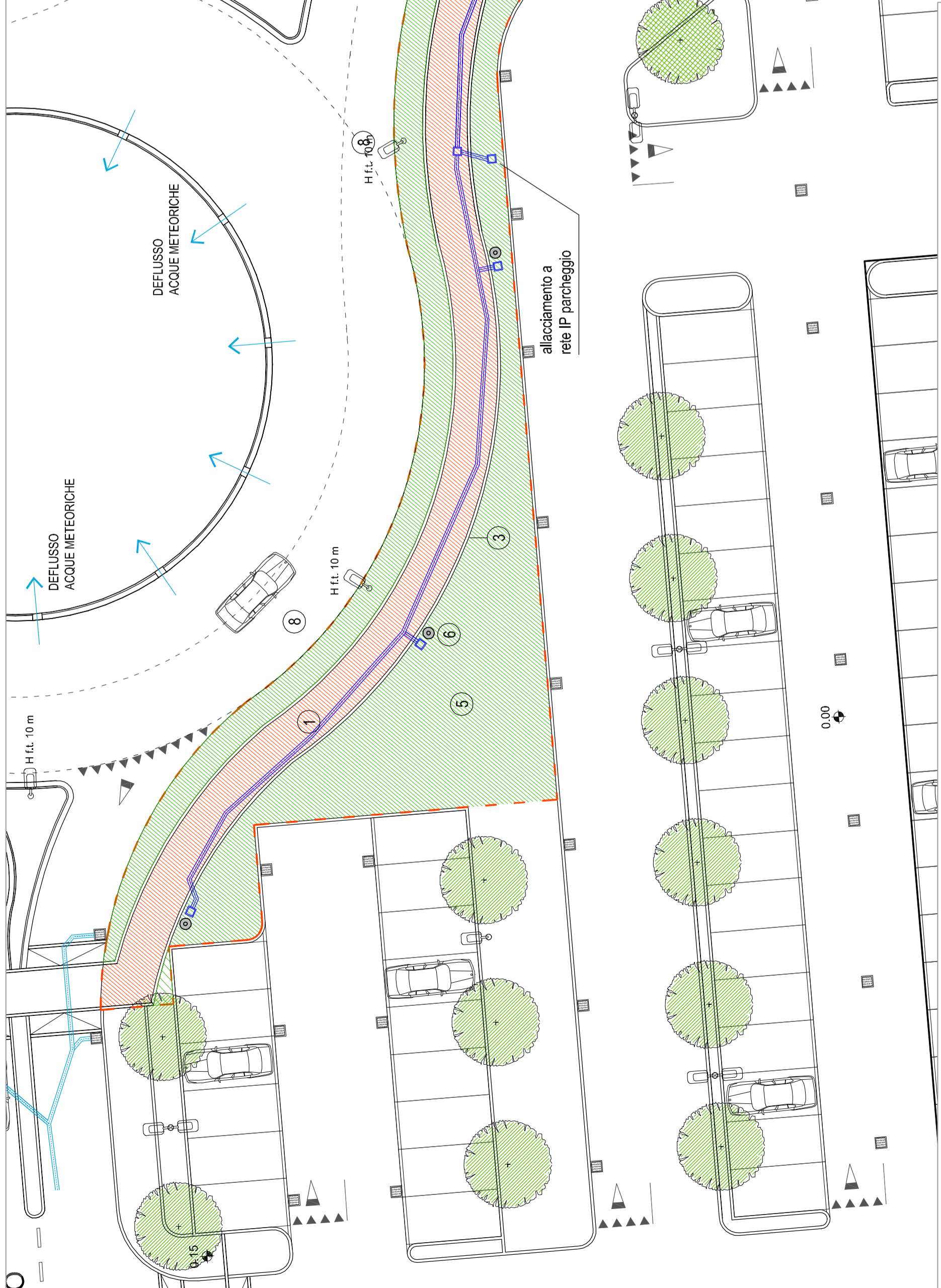
OPERE DI URBANIZZAZIONE SECONDARIA - SETTORE SUD - SCALA 1:200