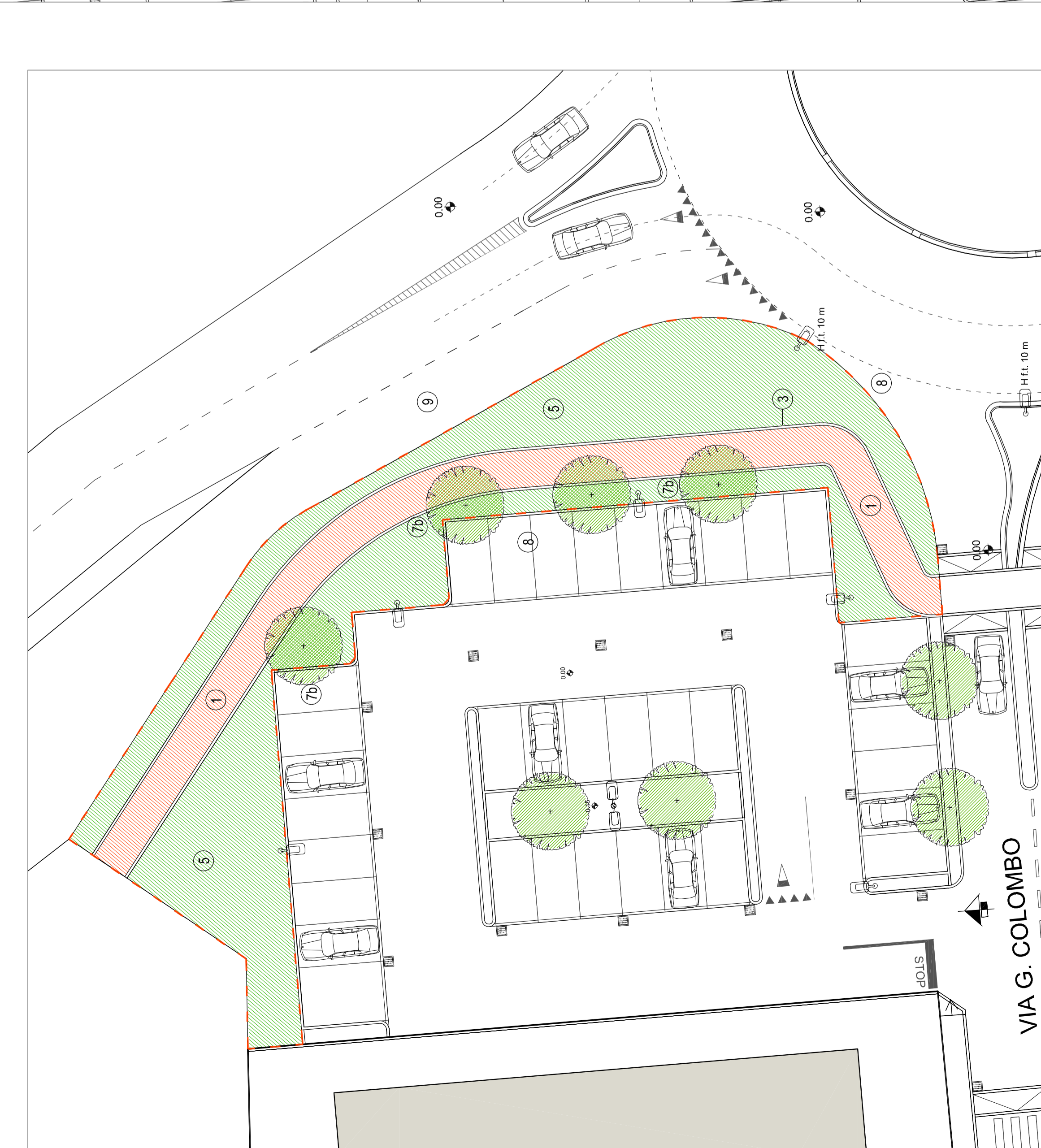
OPERE DI URBANIZZAZIONE SECONDARIA - SETTORE NORD - SCALA 1:200