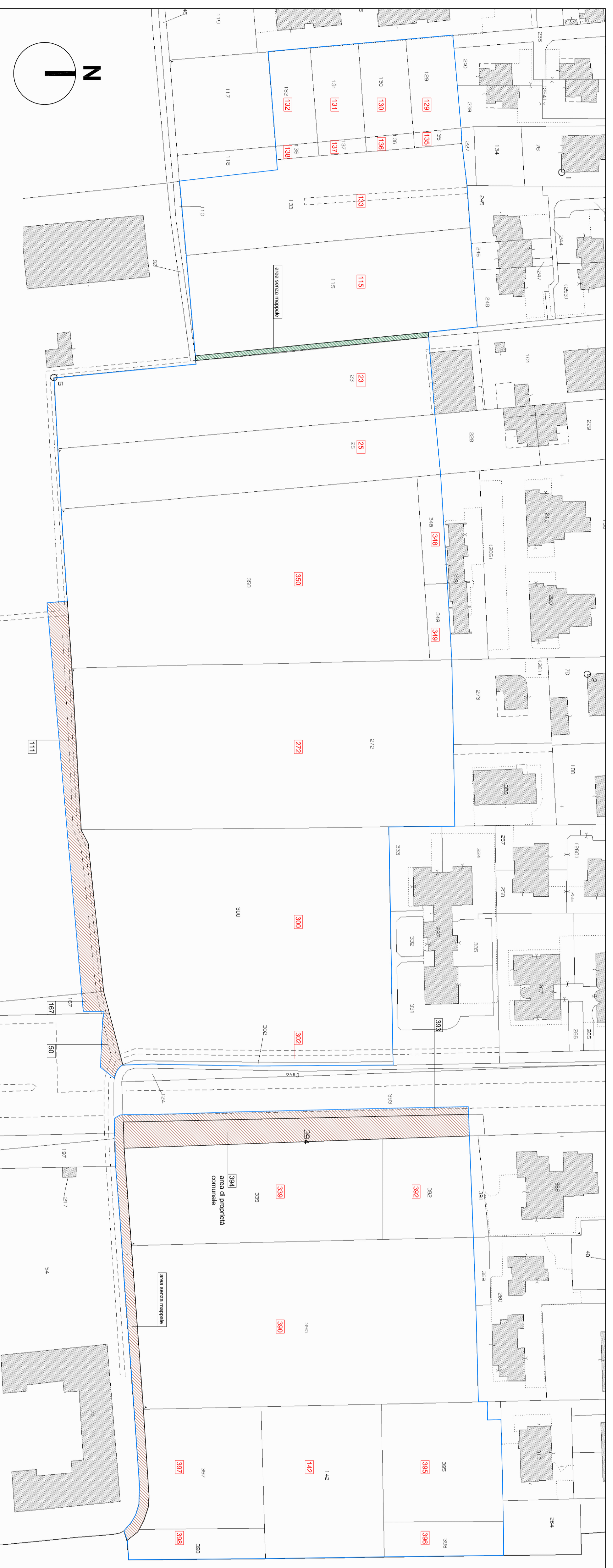
Estratto di mappa catastale - scala 1:750