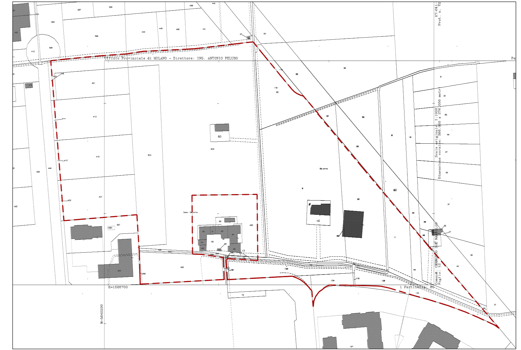
ESTRATTO DI MAPPA FG. 12 - FG. 13 scala 1:2000

+151 PUNTO RILEVATO PLANIMETRICAMENTE +0.06 E RELATIVA QUOTA ALTIMETRICA