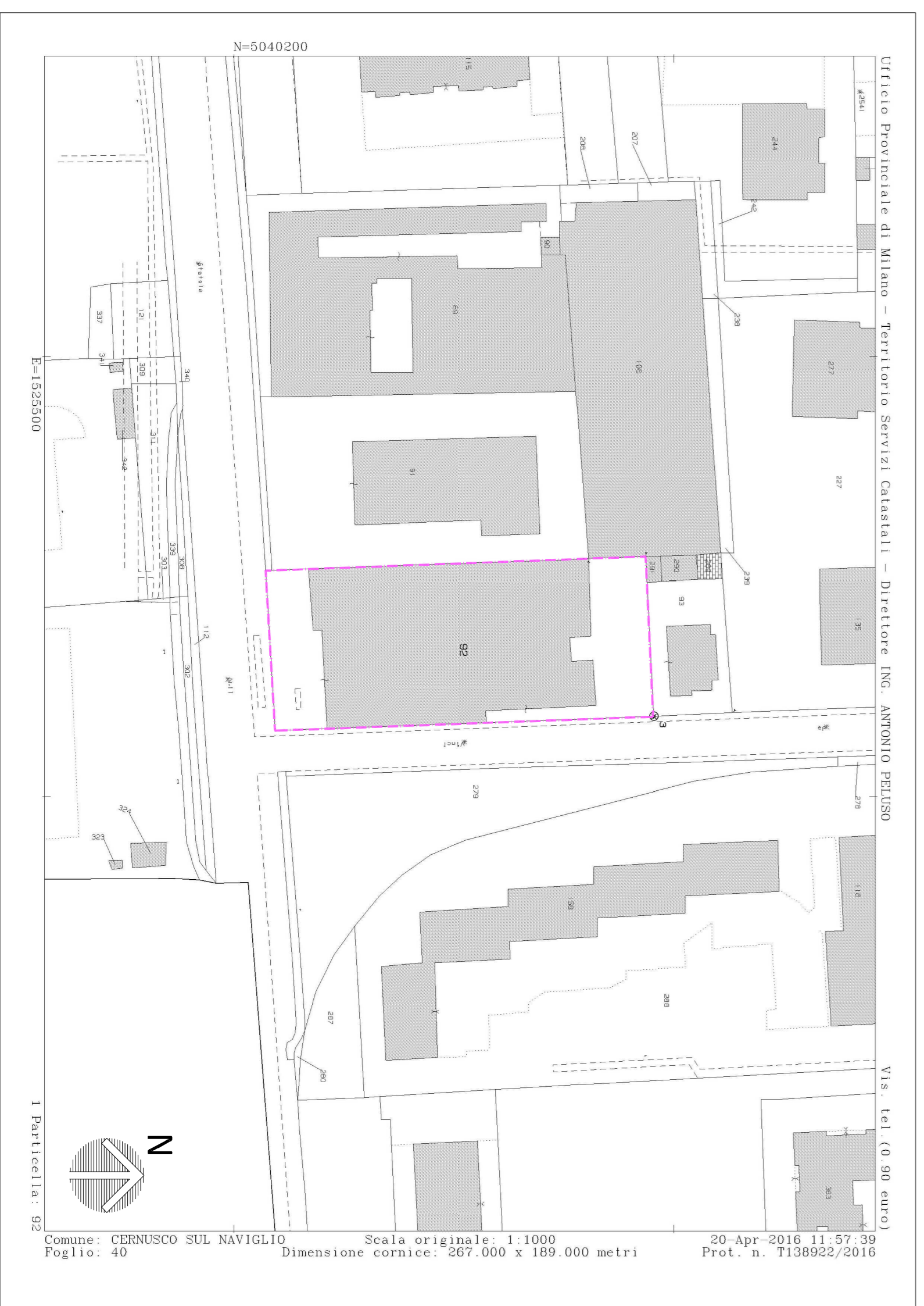
ESTRATTO DI MAPPA scala 1:1000