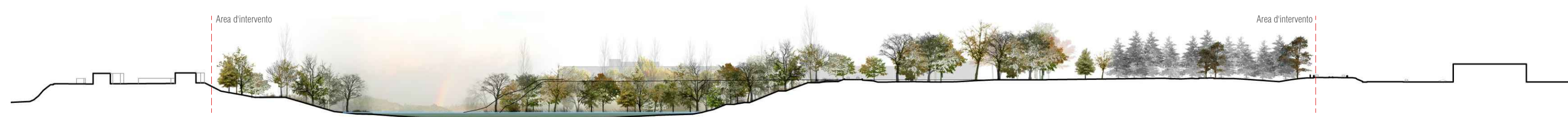
Sezione A-A' scala 1:2000