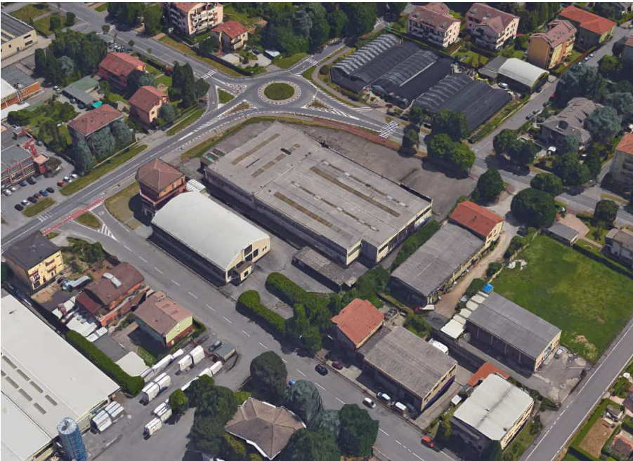
VISTA DA NORD-EST DEL'AREA