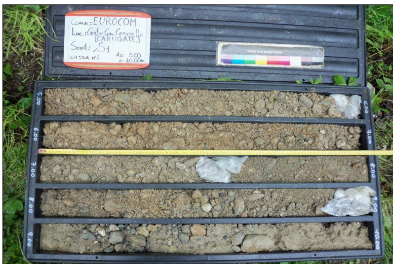
S1 cassa2 5.00-10.00 m