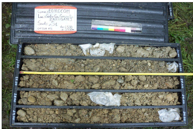
S1 cassa6 25.00-30.00 m