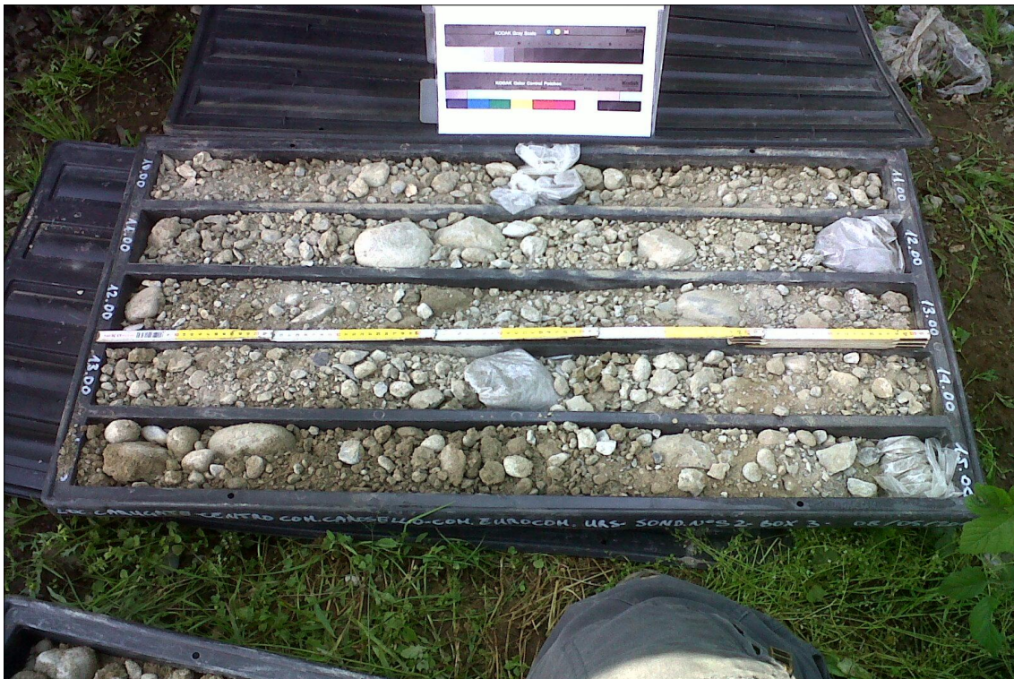
S2 cassa3 10.00-15.00 m