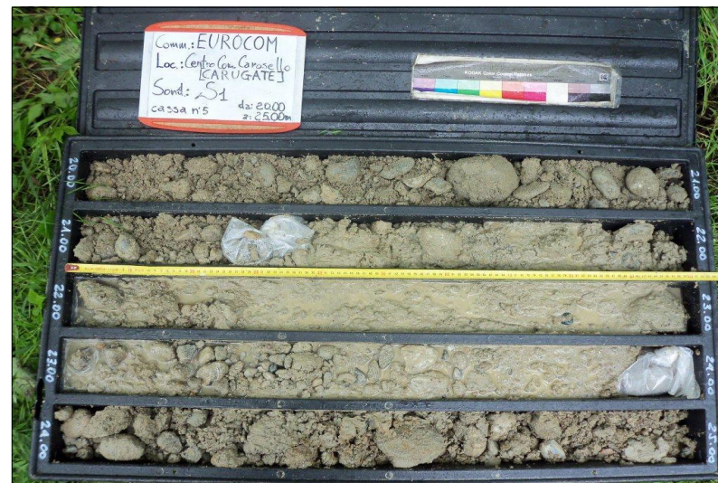
S1 cassa5 20.00-25.00 m