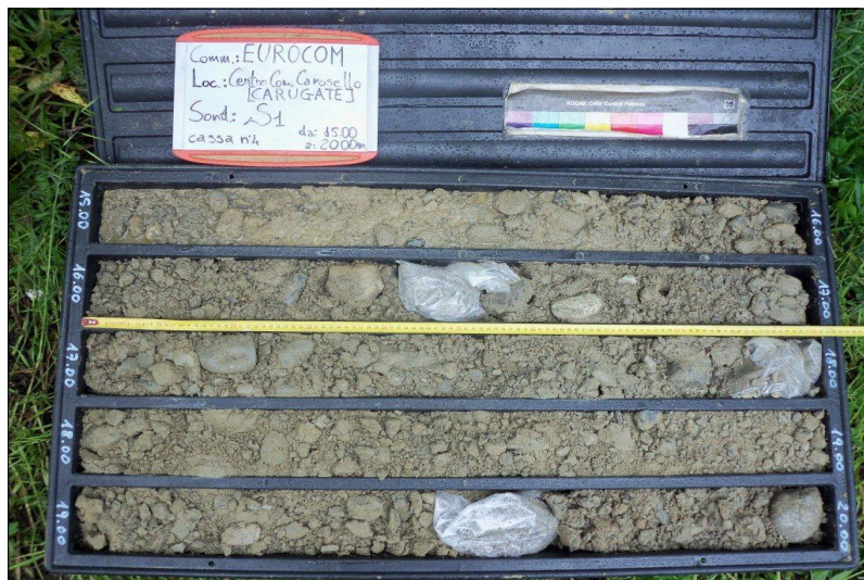
S1 cassa4 15.00-20.00 m