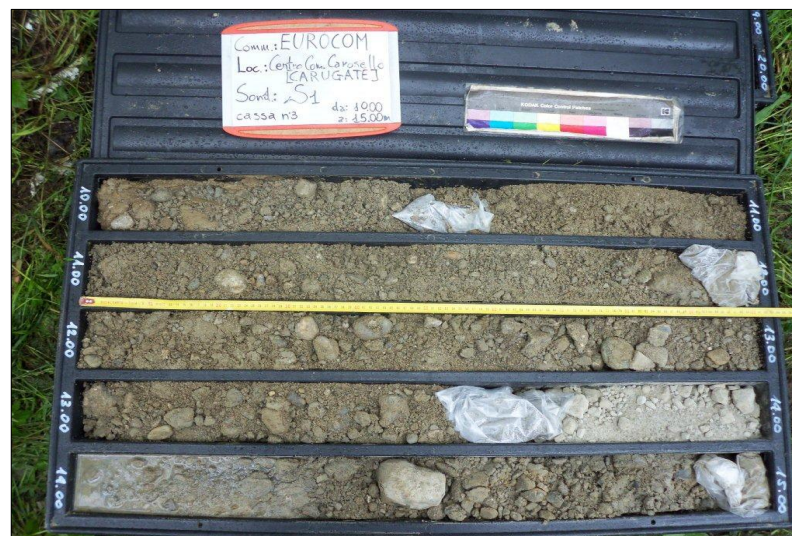
S1 cassa3 10.00-15.00 m