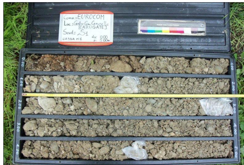
S1 cassa1 0.00-5.00 m