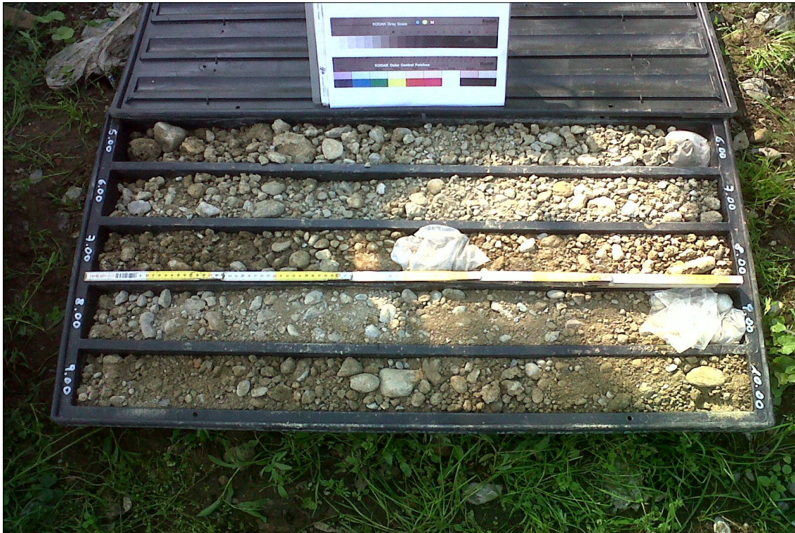
S2 cassa2 5.00-10.00 m