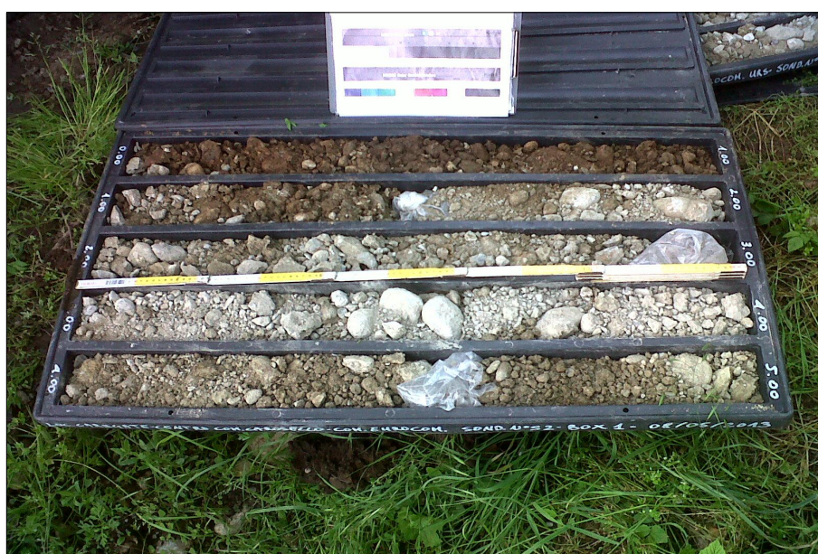
S2 cassa1 0.00-5.00 m