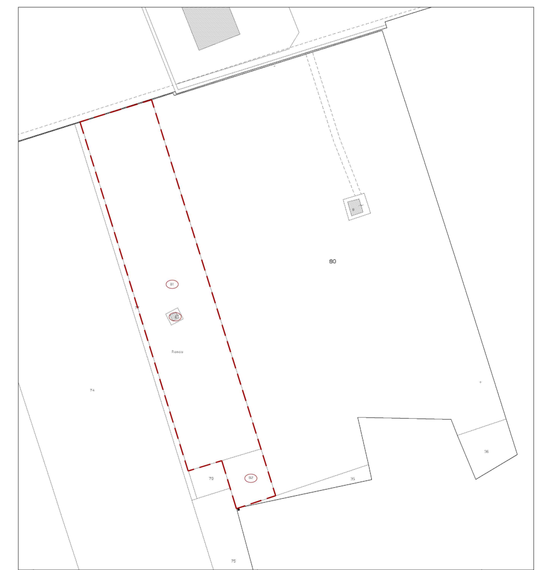
ESTRATTO DI MAPPA FG. 37 map. 6-81-82 scala 1:1000

LEGENDA 118 PUNTO RILEVATO PLANIMETRICAMENTE