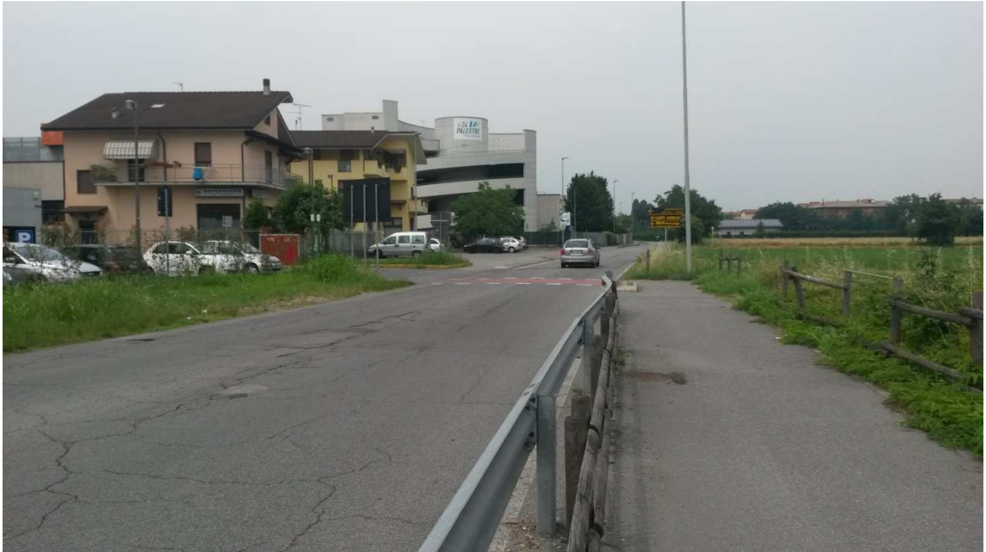
FOTO 1 Vista dalla SP 121 verso via Isola Guarnieri