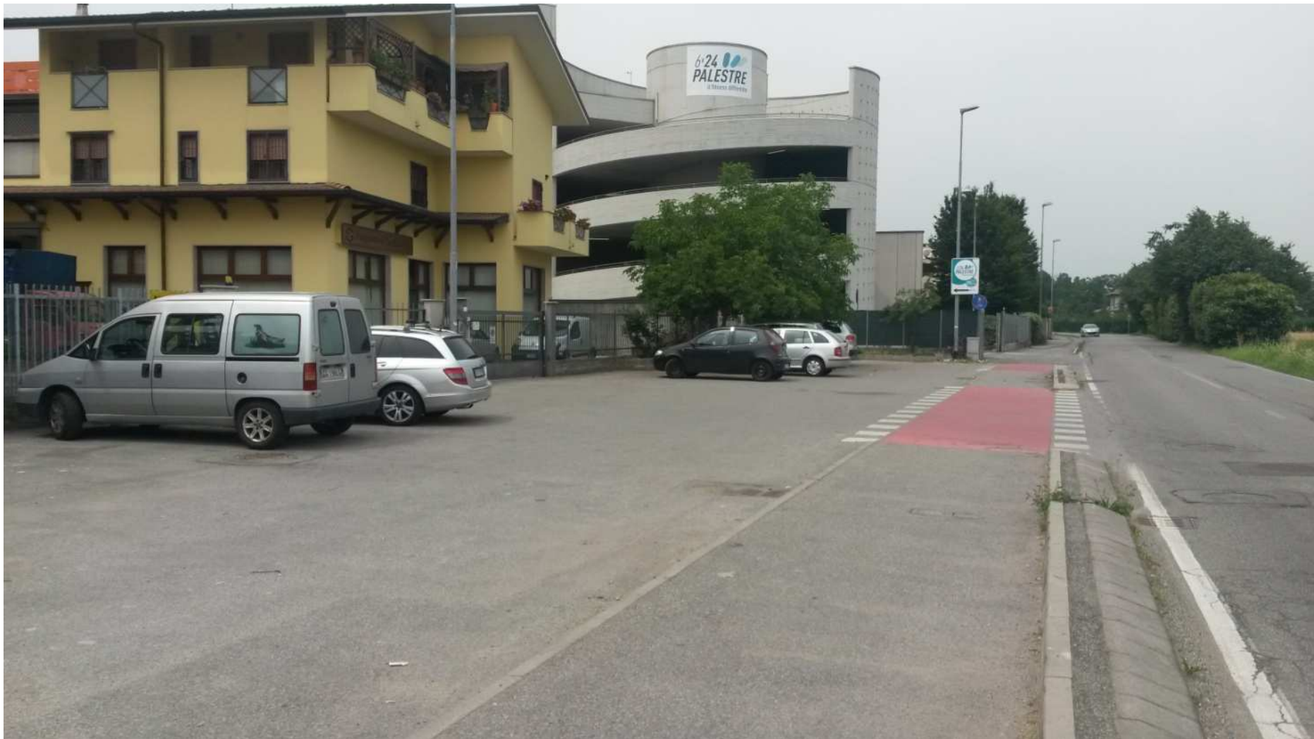
FOTO 6 -Vista parcheggio pubblico su via Isola Guarnieri