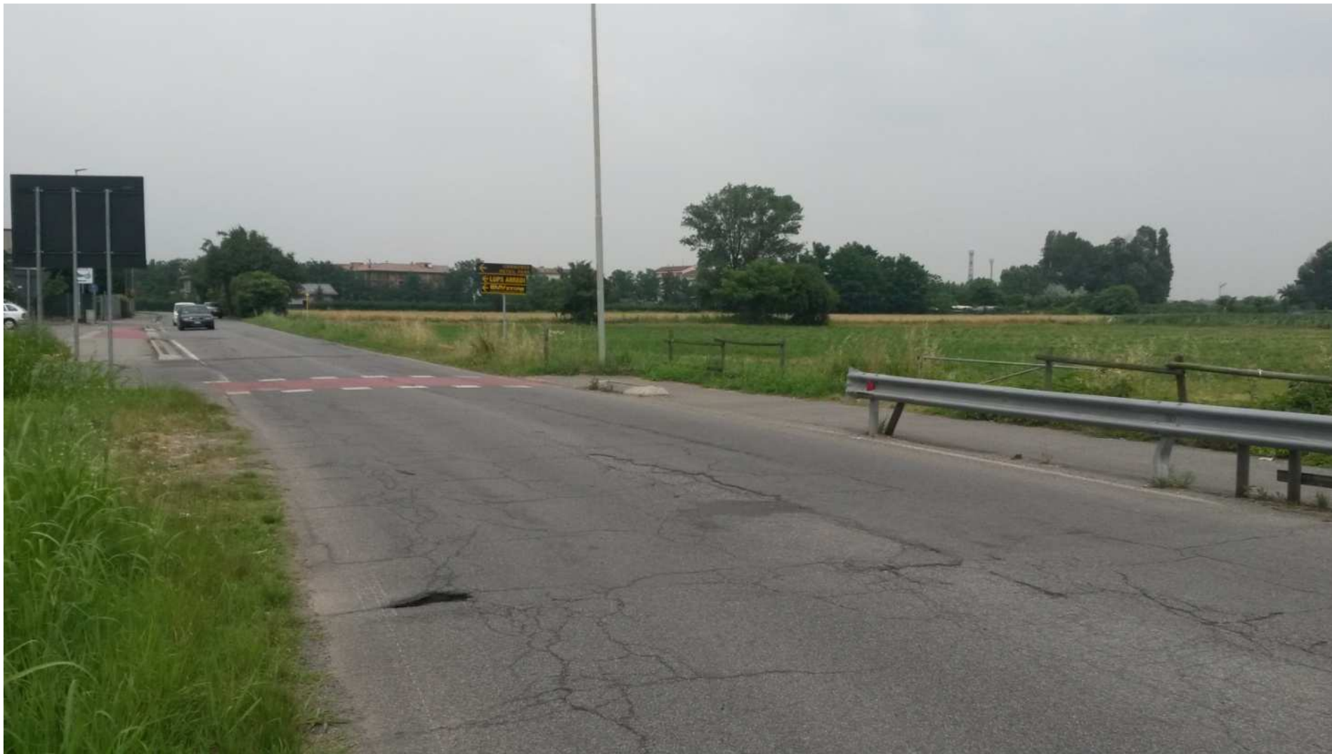
FOTO 3 - Via Isola Guarnieri attraversamento pedonale