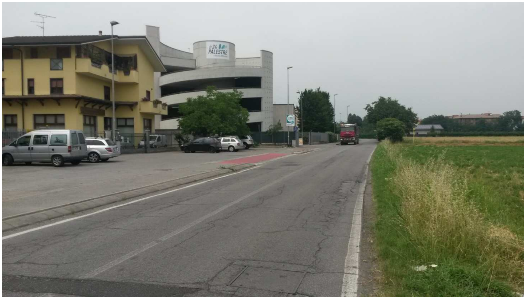
FOTO 7 - Via Isola Guarnieri vista verso Carugate