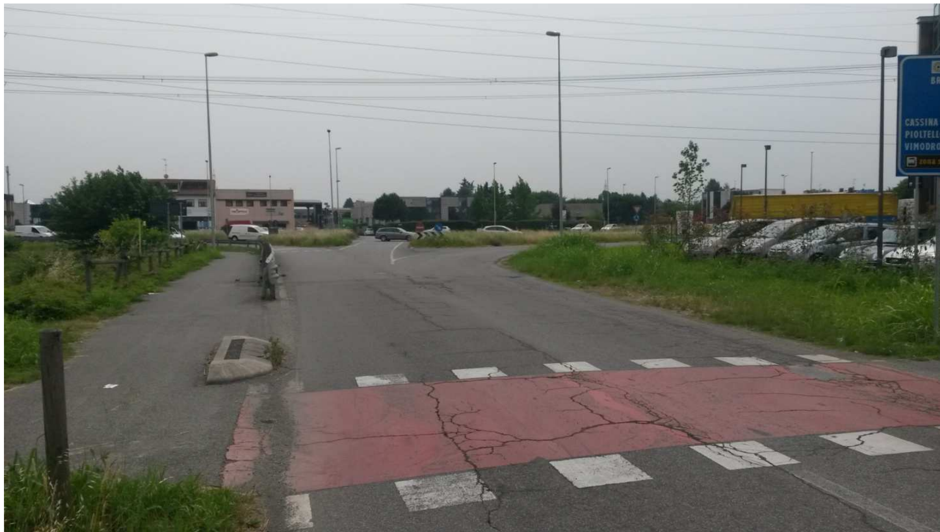
FOTO 2 -Vista dalla via Isola Guarnieri verso la SP 121