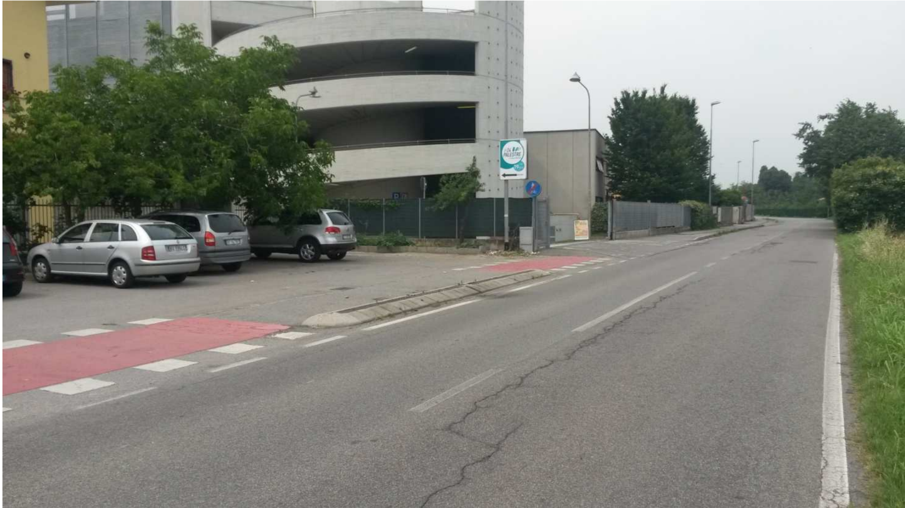
FOTO 8 Via Isola Guarnieri vista verso Carugate ( sulla sinistra parcheggio pubblico )