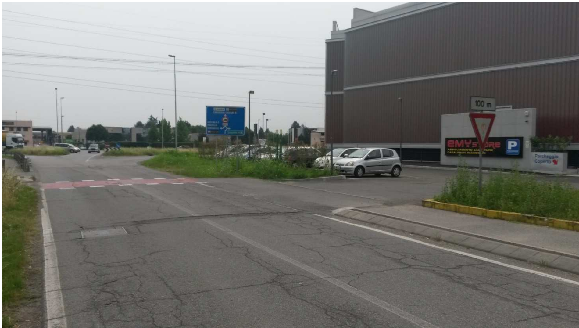
FOTO 4 -Via Isola Guarnieri ingresso al centro commerciale PL Althea