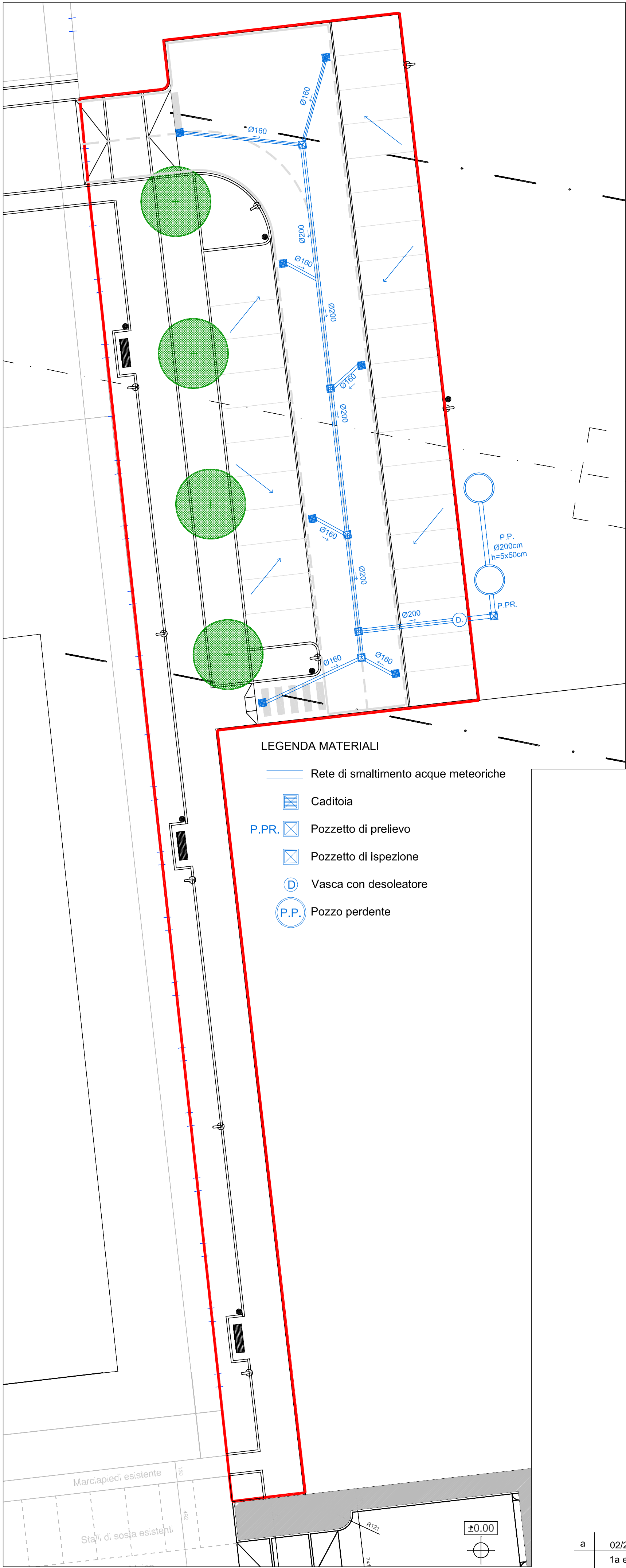
Lotto 3: Sistemazione parcheggio Nord