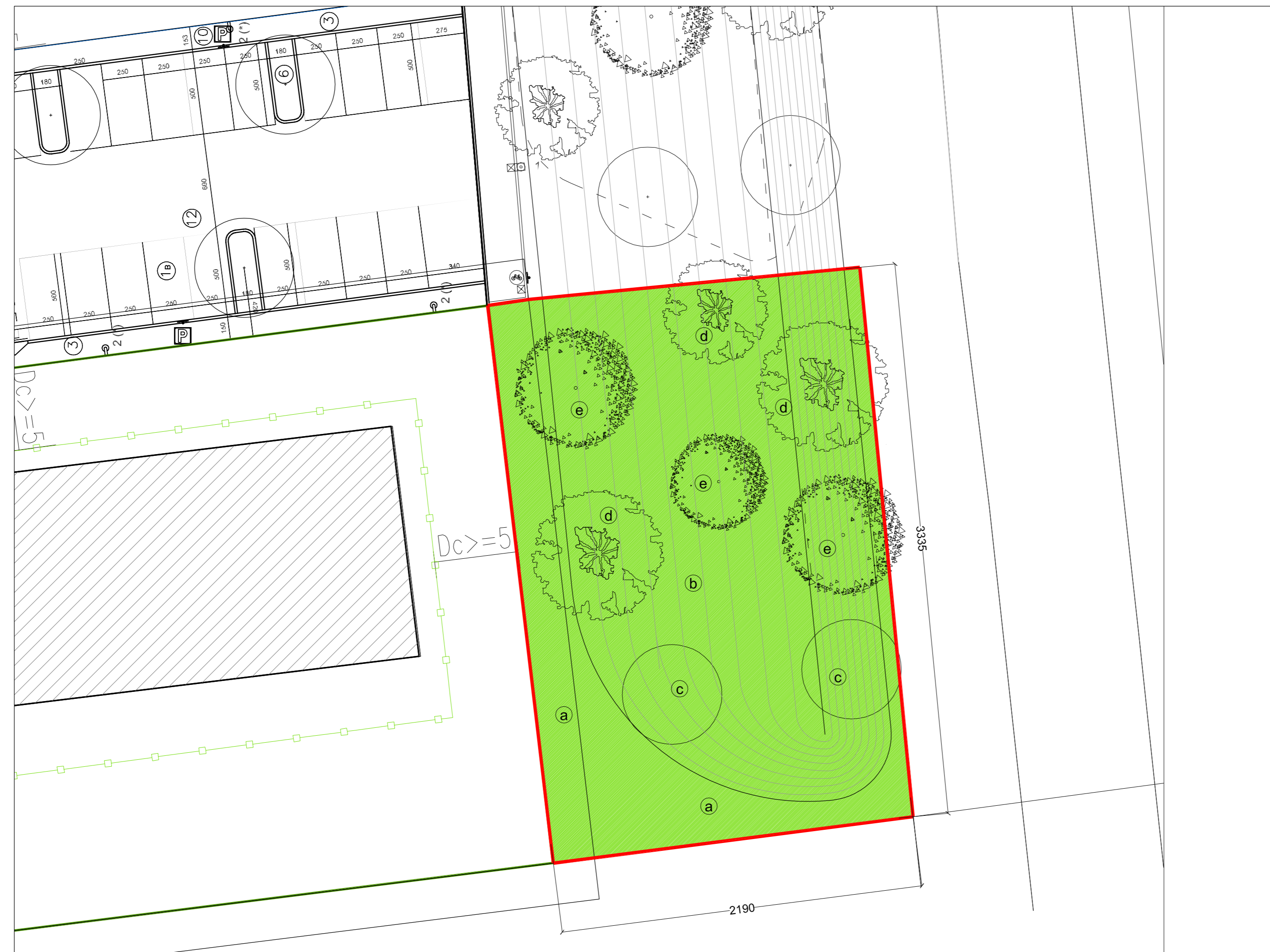
Opere a verde: planimetria - scala 1:200