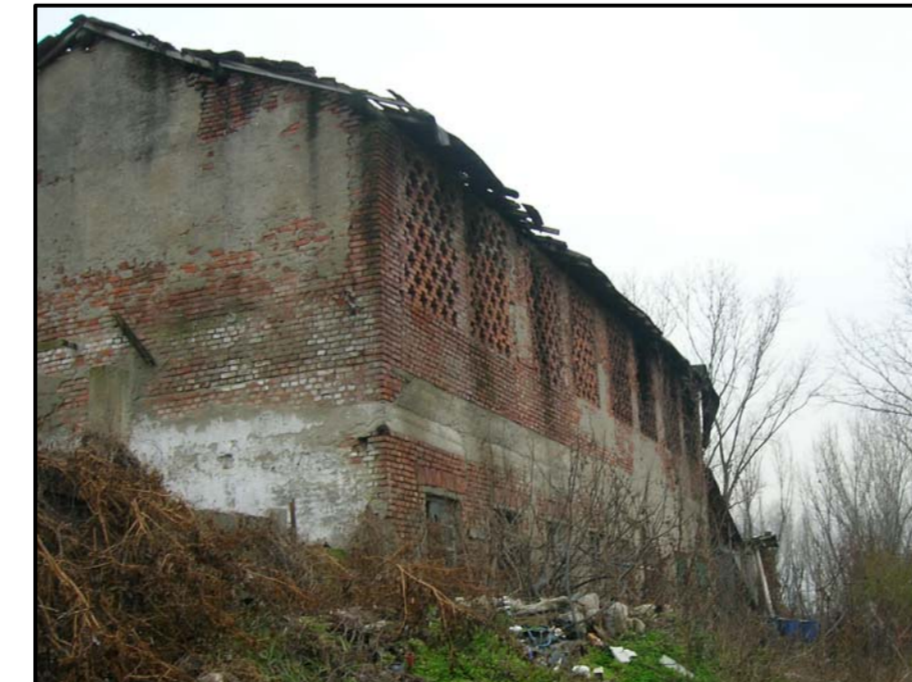
FOTO 9 - PROSPETTO ESTERNO OVEST