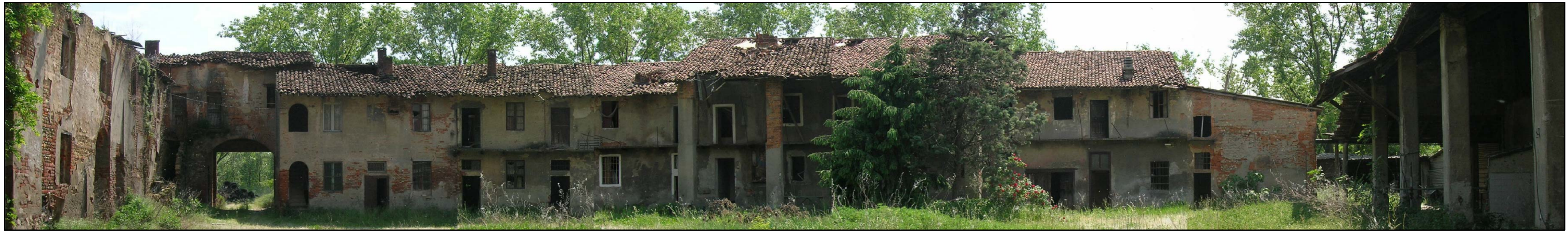
FOTO 1 - PROSPETTO INTERNO NORD