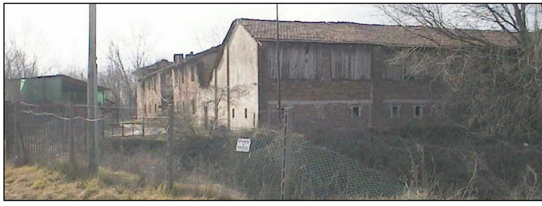
FOTO 5 - PROSPETTO ESTERNO NORD