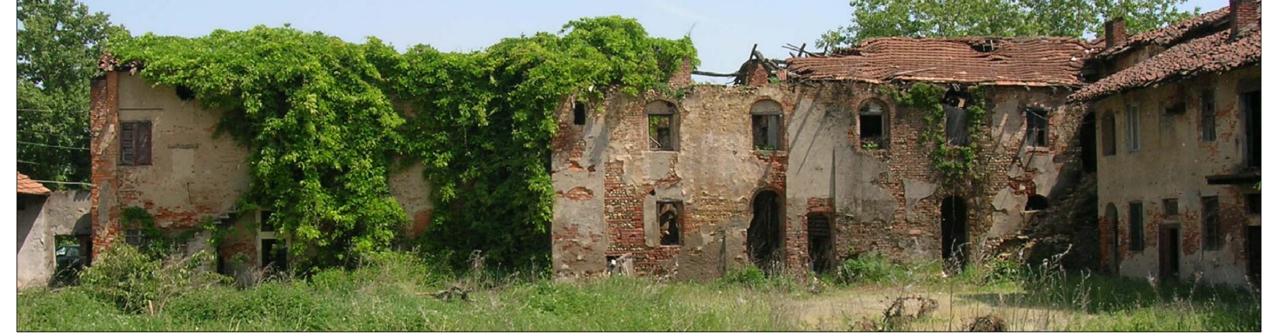
FOTO 4 - PROSPETTO INTERNO OVEST