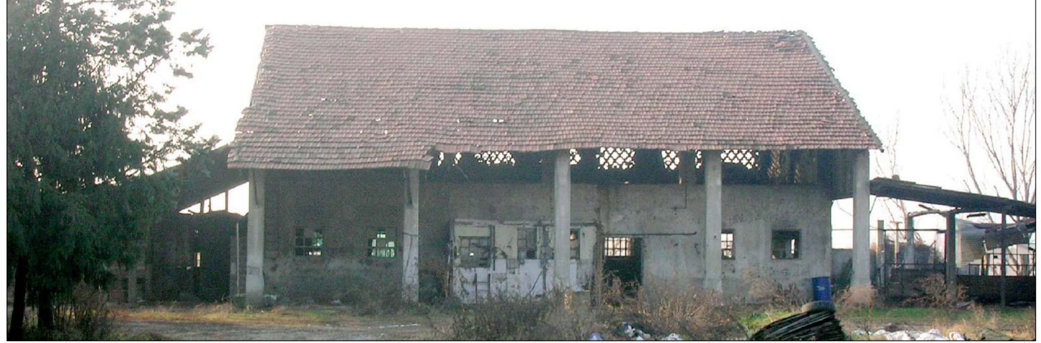
FOTO 3 - PROSPETTO INTERNO EST