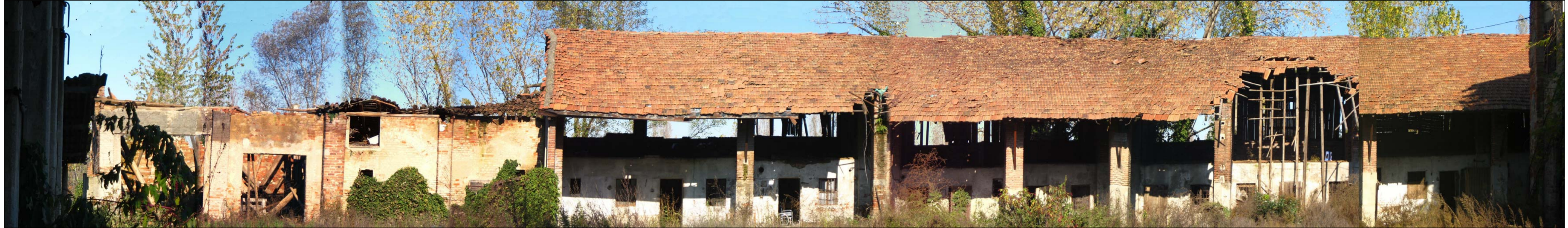
FOTO 2 - PROSPETTO INTERNO SUD