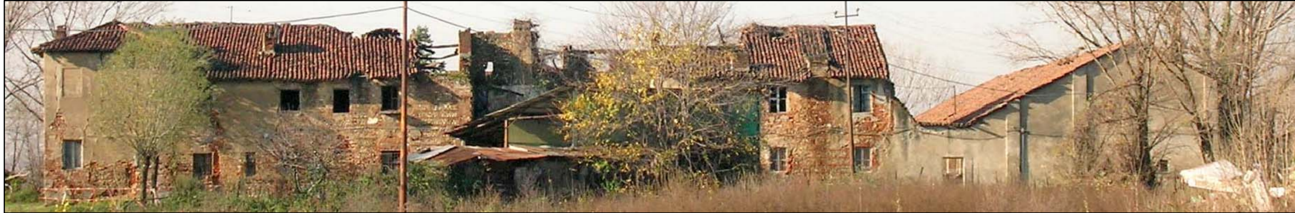
FOTO 10 - PROSPETTO ESTERNO EST