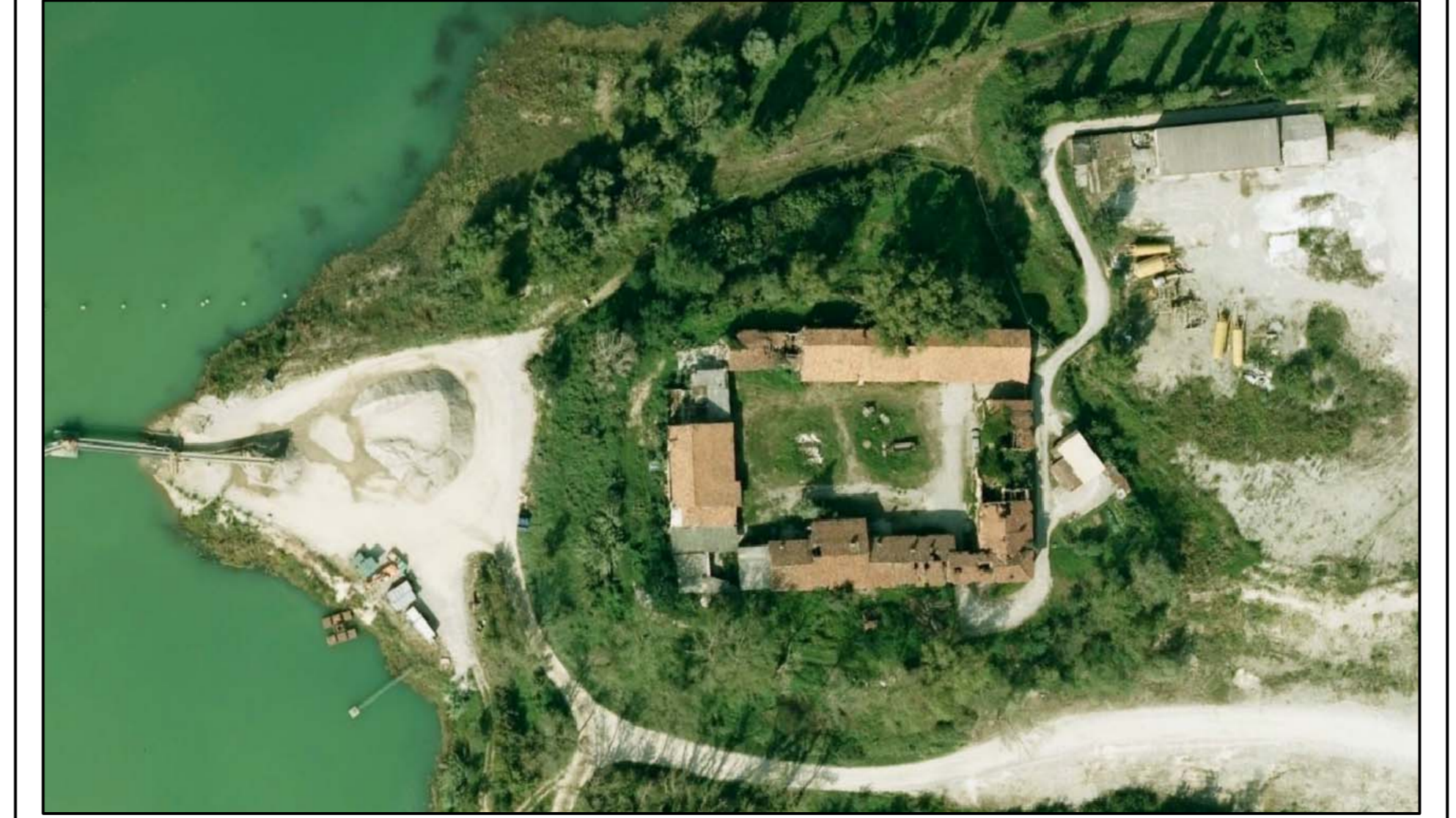
STATO DI FATTO-VISTA DALL'ALTO

DOTT. ARCHITETTO PAOLO GRASSI - Albo di Milano n. 6668 via Turati 13 - 20063 - Cernusco sul Naviglio - MI - tel./fax. 02.92111167 - cell. 335.495076 WEB: www.grassiarchitetture.it Email: info@grassiarchitetture.it