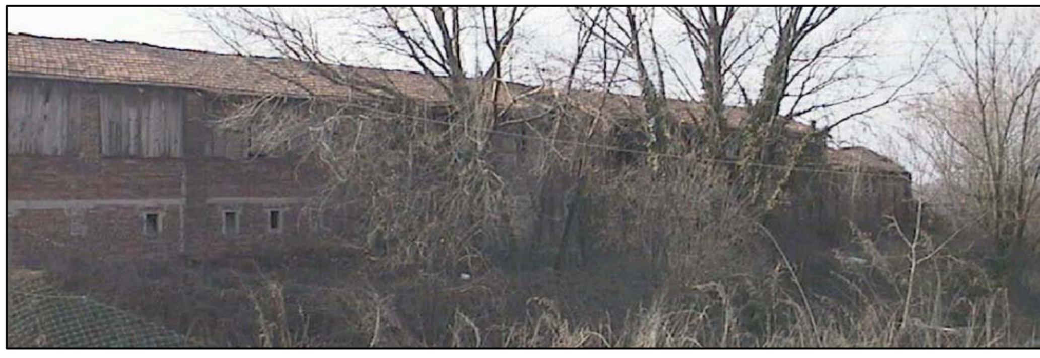
FOTO 6 - PROSPETTO ESTERNO NORD