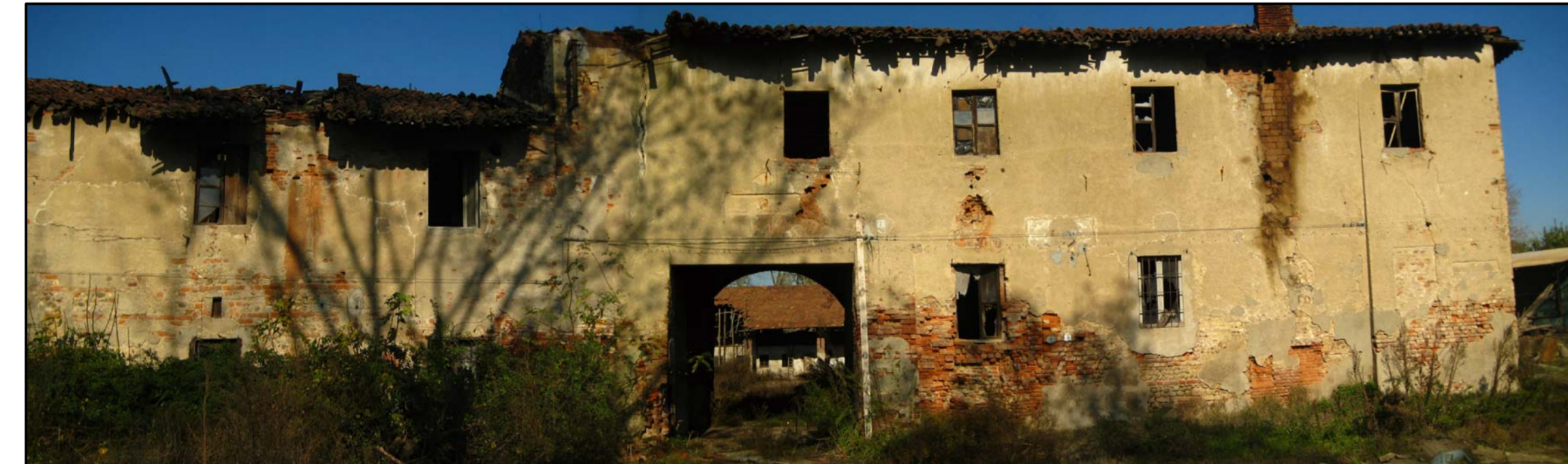
FOTO 8 - PROSPETTO ESTERNO SUD