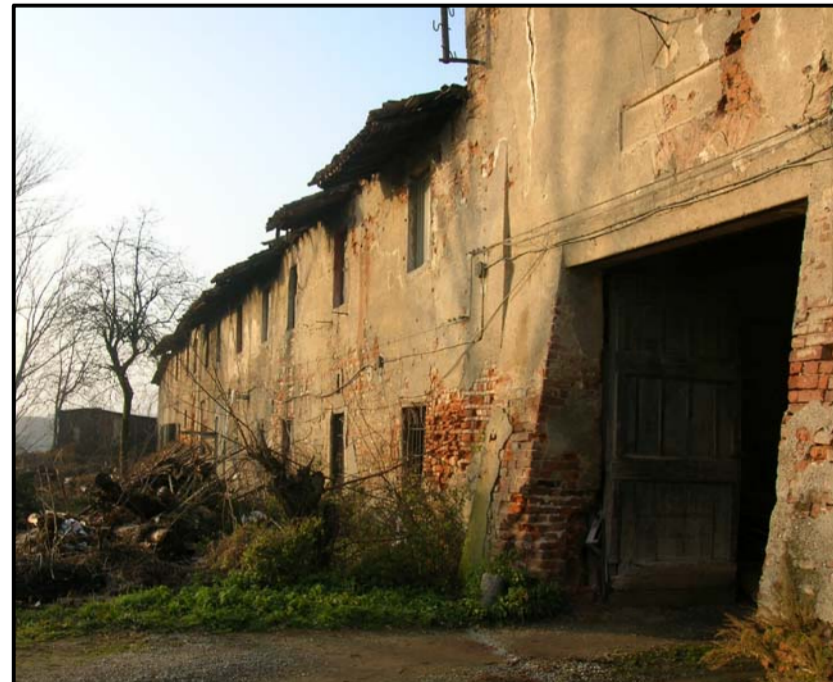
FOTO 7 - PROSPETTO ESTERNO SUD